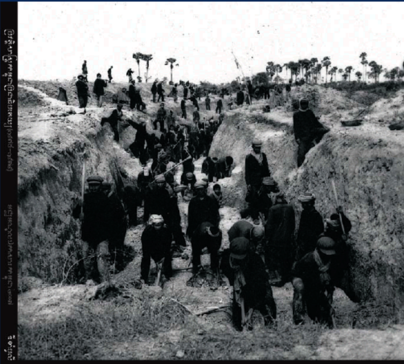
ប្រវត្តិសាស្ត្រកម្ពុជាប្រជាធិបតេយ្យ (១៩៧៥-១៩៧៩) រូបថតស្តីពីការងារសាងសង់ប្រជាធិបតេយ្យ ឆ្នាំ ១៩៧៥