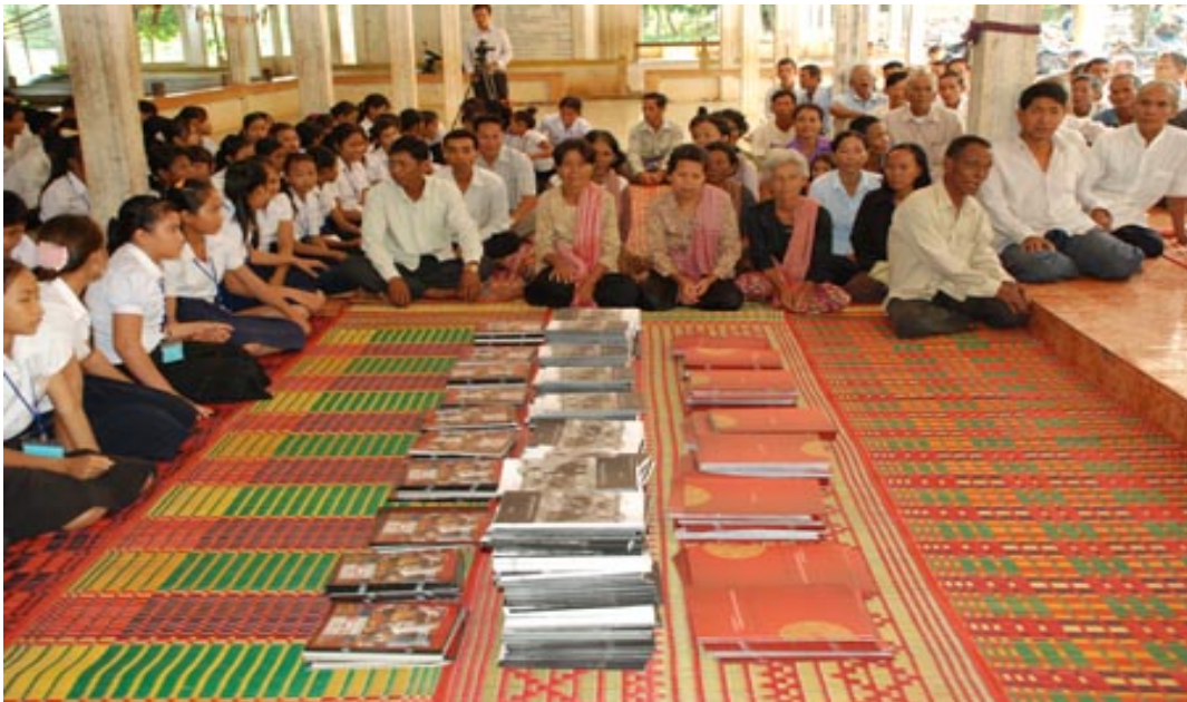
អ្នកចូលរួមនៅក្នុងការធ្វើវេទិកាសាធារណៈស្តីពីការអប់រំប្រវត្តិសាស្ត្រកម្ពុជាប្រជាធិបតេយ្យ នៅឃុំកំពែង ស្រុកគិរីវង់ ខេត្តតាកែវ

ការថែទាំសម្រាប់ប្រវត្តិសាស្ត្រកម្ពុជាប្រជាធិបតេយ្យ វេទិកាសាធារណៈស្តីពីការអប់រំប្រវត្តិសាស្ត្រកម្ពុជាប្រជាធិបតេយ្យ រវាងគ្រូ សិស្ស និងឪពុកម្តាយ ភូមិវត្តភ្នំ ឃុំកំពែង ស្រុកគិរីវង់ ខេត្តតាកែវ ថ្ងៃទី១៧ ខែតុលា ឆ្នាំ២០១០