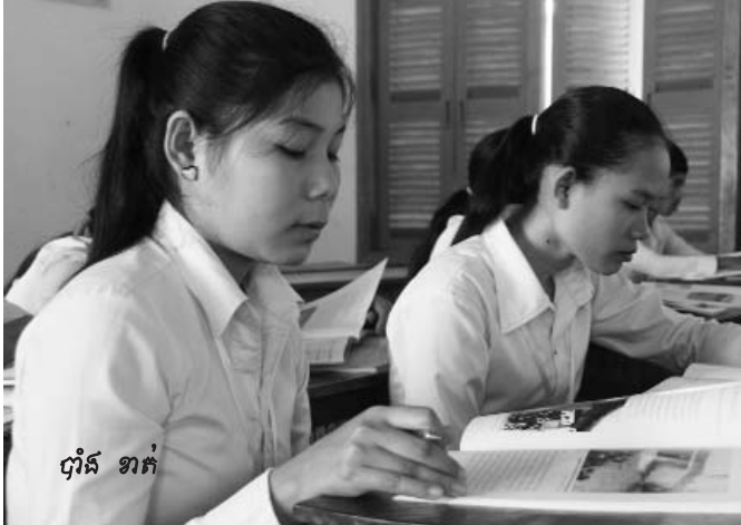
ប្រាំ ខាត

ករុសិស្សស្រីវ័យក្មេងមួយរូប កំពុងបង្កើតប្រវត្តិសាស្ត្រនៅក្នុងវិធីជាច្រើនជាងអ្វីដែលករុសិស្សរូបនេះអាចស្រមៃឃើញ ។ ផ្អែកទៅលើអាកប្បកិរិយារបស់គាត់តែមួយ អ្នកនឹងគិតថា គាត់ក៏មានអារម្មណ៍បែបនេះដែរ ។ ដោយបន្តិចបិចសរសេរនៅដែររបស់គាត់ហើយ ដើរទៅដើរមកនៅចំពោះមុខមិត្តភក្តិដទៃទៀតនៅក្នុងថ្នាក់រៀន គាត់ក្តាប់បិចណែននៅក្នុងដៃ ទប់ដង្ហើម ហើយដើរទៅចំកណ្តាលនៃថ្នាក់រៀន ។ សំឡេងដៃដកគ្នានៅក្នុងថ្នាក់ បានចាប់ផ្តើមខ្សោយទៅ ហើយថ្នាក់ទាំងមូលបានត្រៀមខ្លួនរួចរាល់ដើម្បីចាប់ផ្តើមមេរៀនបាន ។ ស្ថិតក្នុងសម្លៀកអាវពណ៌លឿងខ្ចី និងសំពត់ពណ៌ខៀវវែង ជាមួយនឹងស្បែកជើង ប្រាំ ខាត ដែលជាករុសិស្សវ័យ២១ឆ្នាំ កំពុងត្រឡប់មកវិញនៃកេរដំណាលរបស់អង្គជំនុំជម្រះវិសាមញ្ញក្នុងតុលាការកម្ពុជា ។