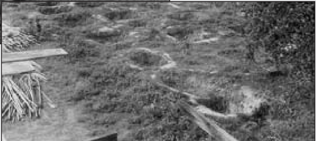
រណ្តៅវាលពិឃាត ជើងឯក