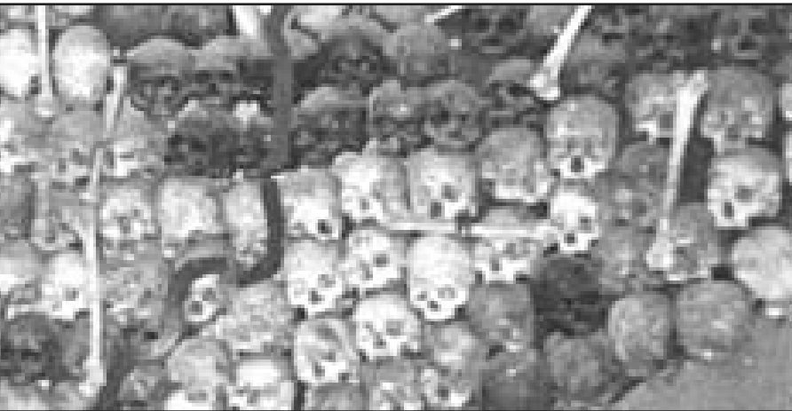
មកទល់បច្ចុប្បន្ននេះ មជ្ឈមណ្ឌលឯកសារកម្ពុជាបានស្រាវជ្រាវរកឃើញទីតាំងសម្លាប់មនុស្សក្នុងរូបប្តូរខ្មែរក្រហមចំនួន៥៥៤០ កន្លែងរួចមកហើយ ។ ការសិក្សាជាលម្អិតអំពីទីតាំងសម្លាប់និងប្រព័ន្ធសន្តិសុខខ្មែរក្រហមបាននឹងកំពុងប្រព្រឹត្តទៅ ។ ចំណុចនីមួយៗនៅលើដៃនៃនេះគឺជាចំណុចកំណត់ទីតាំងនៃរណ្តៅសាកសពតុក និងបូជនីយដ្ឋានតម្កល់អង្គរវិហារ ។

ខ្ញុំត្រូវបានបុករុកយ៉ាងខ្លាំងដោយវត្ថុដ៏ស្រួចមួយ និងត្រូវ