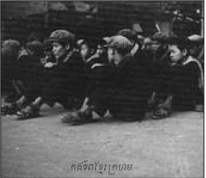
កងទ័ពខ្មែរក្រហម

ផងយល់ឃើញផ្សេងទៅវិញថា ទុក្ខក្នុងកម្មដែលខ្មែរក្រហមបាន ប្រព្រឹត្តគឺសាហាវយង់ឃ្នងណាស់ ដូច្នេះពុំអាចឲ្យមានការ លើកលែងទោសបានទេ ។ បញ្ហានេះបណ្តាលឲ្យមានការលើកឡើង នូវសំណួរដែលមានលក្ខណៈចិត្តសាស្ត្រនិងទស្សនវិជ្ជាដ៏សំខាន់ អំពីការកំណត់ព្រំដែននៃការអត់ឱនត្រាប្រណីចំពោះមនុស្សមាន ទុក្ខក្នុងកម្មដ៏សែនរន្ធត់មួយចំនួន ដែលការអត់ឱនចំពោះទុក្ខក្នុង ទាំងនេះជាផ្លូវការ (លើសពីការលើកលែងទោសជាបុគ្គល) អាច