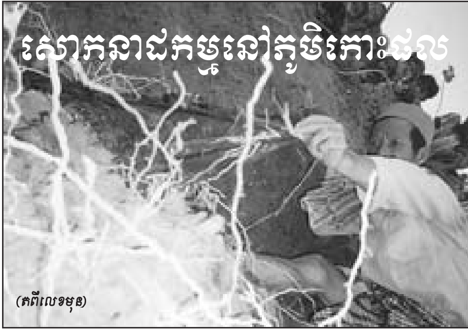
(ភីលេខ១២១)