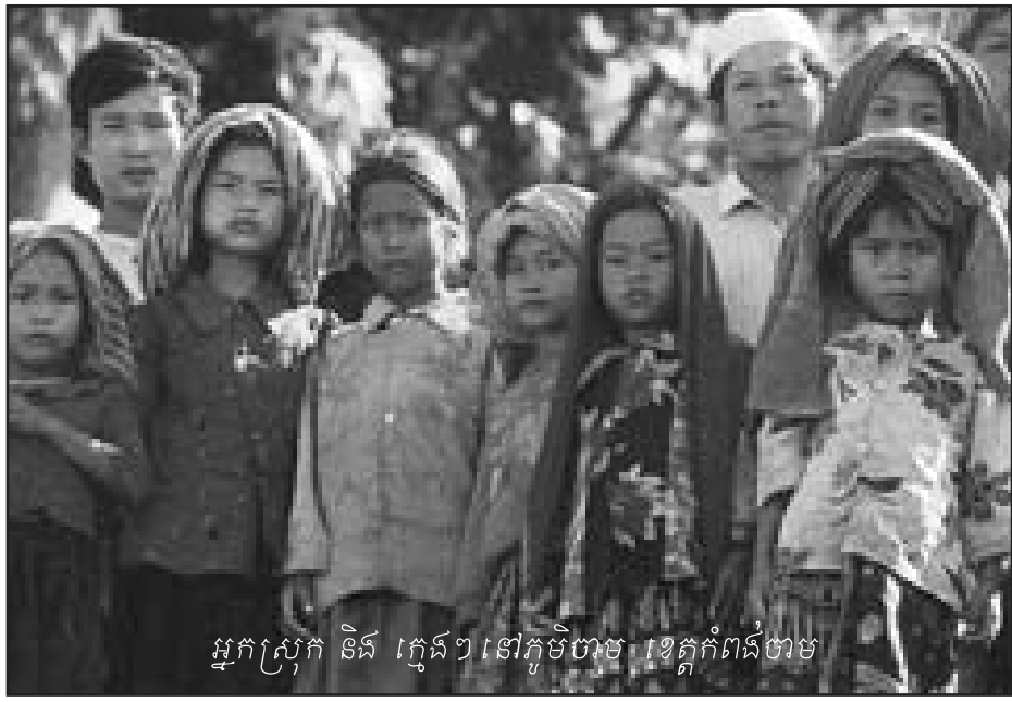
អ្នកស្រុក និង ក្មេងៗ នៅភូមិបាម ខេត្តកំពង់ចាម