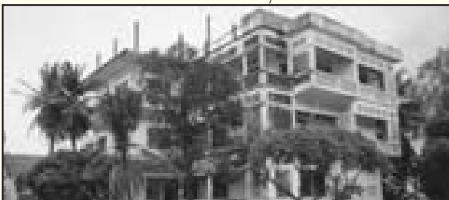
អតីតផ្ទះតាម៉ុកនៅទីរួមខេត្តកាកែវ

- កំណាព្យខ្មែរក្រហម: ទិដ្ឋភាពថ្មីនៃជនបទកម្ពុជា..... ក្របក្រៅ