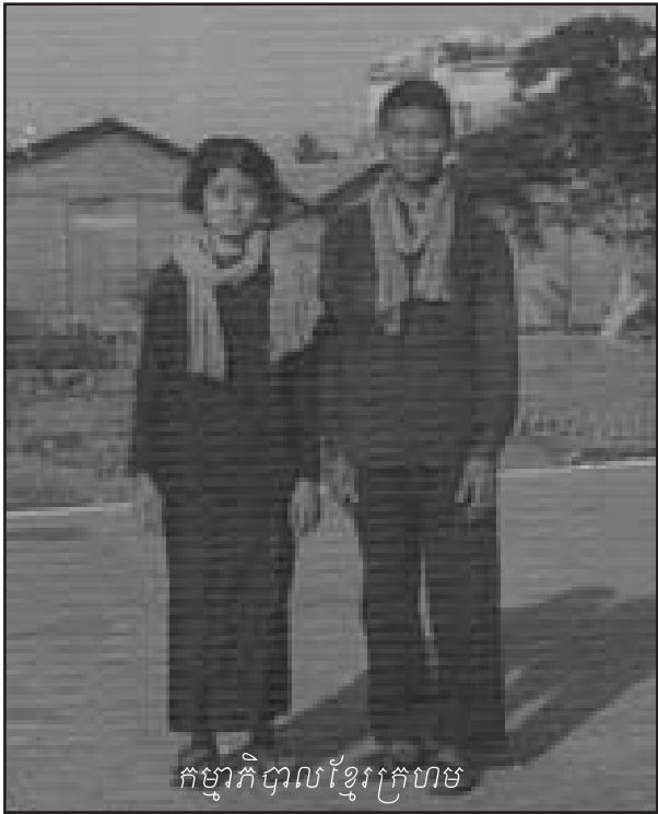
កម្មាភិបាលខ្មែរក្រហម

អ្នកដែលបានផ្តល់បទសម្ភាសន៍ទាំងនោះគាំទ្រការលើក លែងទោសក្រោមលក្ខខណ្ឌដែលបានលើកឡើងខាងលើ ហើយ បានពន្យល់ការអត់ទិសទោសរបស់ខ្លួនតាមទ្រឹស្តីរបស់ព្រះពុទ្ធ ។ ជំនឿថា «ពៀររំលាប់ដោយការមិនចងពៀរ» ត្រូវបានលើក ឡើងជាច្រើនលើកច្រើនសារនៅក្នុងបទសម្ភាសន៍ ។ វាជាការ សំខាន់ដែលត្រូវកត់សម្គាល់ថា ជំនឿទៅលើការលើកលែង ទោសតែងតែពុំត្រូវបានរួមបញ្ចូលមេដឹកនាំខ្មែរក្រហមកំពូលៗ ឡើយ ។ អ្នកដែលបានផ្តល់បទសម្ភាសន៍ម្នាក់បានរំលឹករឿង របស់អង្គុលីមា ដែលបានប្រព្រឹត្តិ ទម្រង់កម្មវិធីរួមនិងនិរន្តិយ រមើមនៅក្រោមការគ្រប់គ្រងចិត្តនិងការបញ្ជាពីត្រូវរបស់ខ្លួន ។ កូនសិស្សវ័យក្មេងរូបនេះត្រូវបានអត់ទិសទោស ប៉ុន្តែត្រូវរបស់ កូនសិស្សនេះពុំត្រូវបានលើកលែងទោសឡើយ ។ អ្នកដែលបាន ផ្តល់បទសម្ភាសន៍ខាងលើបាន ប្រដូចរឿងនេះទៅនឹងស្ថានភាព របស់ខ្មែរក្រហមហើយបានទទួលថា ពុំត្រូវផ្តល់ការលើកលែងទោស ដល់មេដឹកនាំកំពូលៗរបស់របបនោះឡើយ ។ ដូច្នោះទាំងតាម ផ្លូវលោក ទាំងតាមផ្លូវធម៌ ការលើកលែងទោសពុំអាចធ្វើឡើង ជាទូទៅឡើយ ។