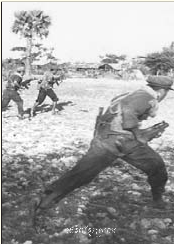
កងទ័ពខ្មែរក្រហម