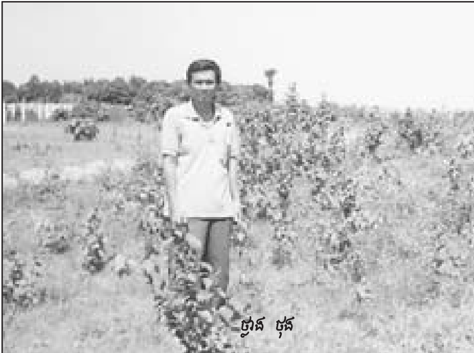
ថ្នាក់ ថុន

វប្បធម៌ស្រុកដែលបានស្រង់ចាប់ពី ឆ្នាំ១៩៨៤មក ។ មានស្ថិតិជនរង គ្រោះទូទាំងឃុំនិងទីតាំងសម្រាប់ តាម ភូមិ-ឃុំ ។ តាមឯកសាររបស់ ការិយាល័យវប្បធម៌ស្រុកបង្ហាញថា ជនរងគ្រោះទូទាំងឃុំ មានចំនួន ៧៨៤៧៦ នាក់ ហើយមានរហូត ដល់៣៣ទីតាំង ។ ប៉ុន្តែយើងបានចុះ ស្រាវជ្រាវបានតែ៣កន្លែងប៉ុណ្ណោះ ។ ក្រៅពីនេះមានព័ត៌មានមួយ បញ្ជាក់ថា នៅទីតាំងភ្នំត្រយ៉ូងចំនួន ជនរងគ្រោះមានរហូតទៅដល់ ៤០០០០ នាក់ ទីនោះជាក្រុមធំនិងជា