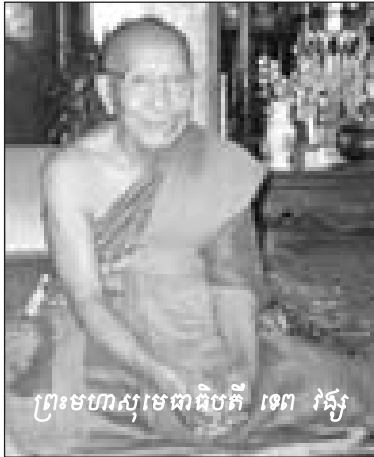
ព្រះ មហា សុខ ធារិ បតី ទេព វង្ស

សួរ : ខ្ញុំ ព្រះ ករុណា ចង់ សួរ ព្រះ តេជគុណ ថា តើ ក្នុង របប ខ្មែរ ក្រហម រឿង វា វ៉ៃ នៃ ការ សម្លាប់ មនុស្ស វា ជា រឿង របស់ មនុស្ស លោក ឬ ជា បុណ្យ បាប ព្រះ តេជគុណ ?