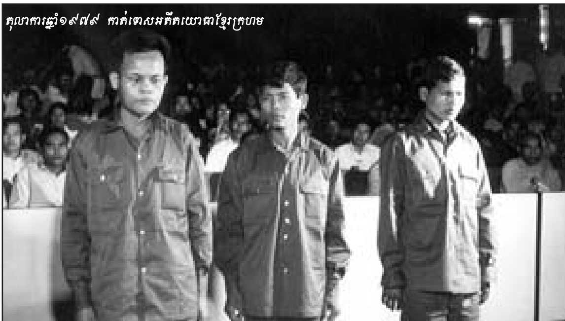
តុលាការឆ្នាំ១៩៧៩ កាត់ទោសអតីតយោធាខ្មែរក្រហម

មិនតែប៉ុណ្ណោះ បង្ការនៃសិទ្ធិមនុស្សក៏ជាការសម្តែងជា លាយលក្ខណ៍អក្សរនូវការកិច្ចនិងកាតព្វកិច្ចផ្នែកសីលធម៌ដែរ ។