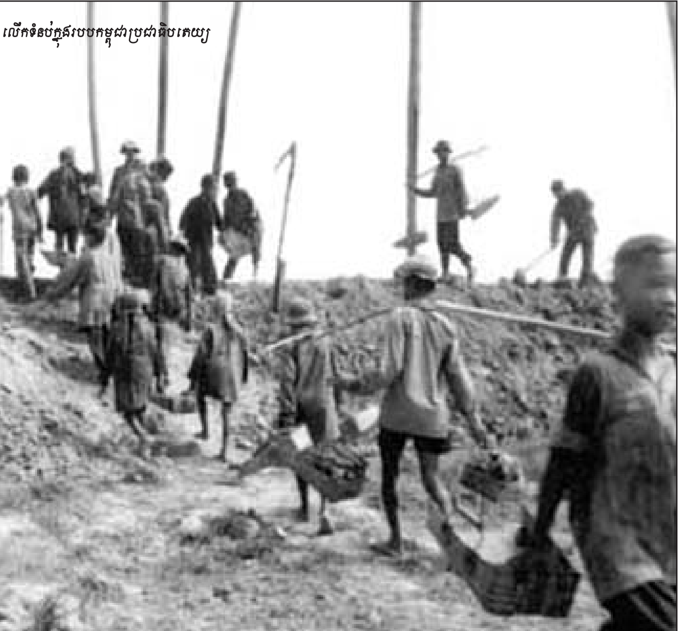
លើកទំនប់ក្នុងរបបកម្ពុជាប្រជាធិបតេយ្យ