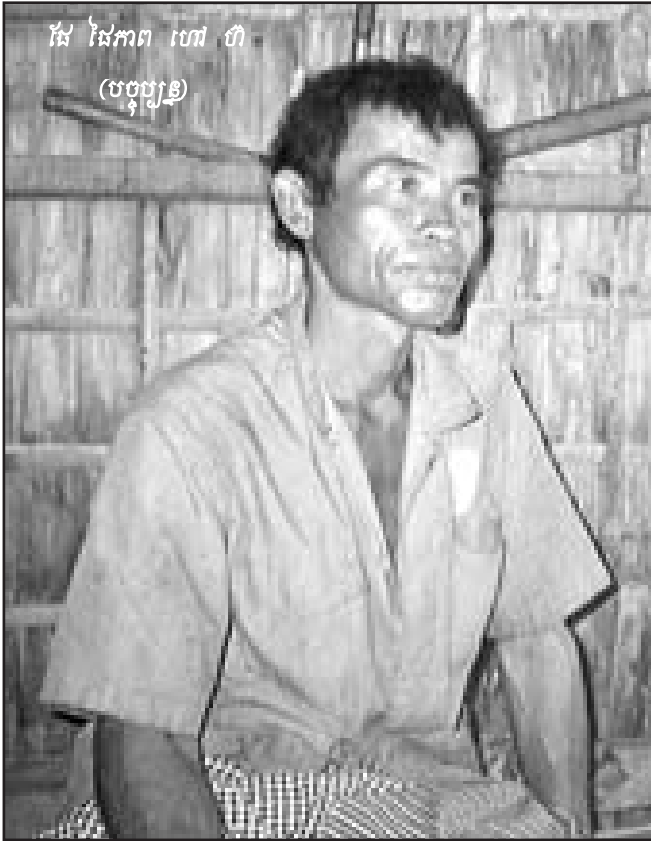
ផៃ ផៃភាព ហៅ ហី (បច្ចុប្បន្ន)

ប៉ុណ្ណោះ ។ នេះមិនយុត្តិធម៌ទាល់តែសោះ ប្រសិនបើស្លាប់គឺស្លាប់ទាំងអស់គ្នា ពីព្រោះយើងជាអ្នកដឹកនាំទៅ ។