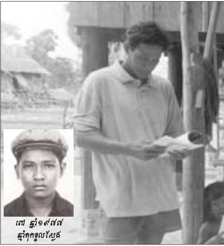
ពៅ ឆ្នាំ១៩៧៧ ឆ្នាំកុកទូលស្មែង

ដើម្បីយុត្តិធម៌ ដែលអាចទទួលយកបាន សម្រាប់ជន រងគ្រោះនៃរបបវាលពិឃាតនេះ អង្គការសហប្រជាជាតិ និង រាជរដ្ឋាភិបាលកម្ពុជា ត្រូវតែបំពេញកាតព្វកិច្ចរបស់ខ្លួនក្នុងការ ស្វែងរកដំណោះស្រាយជាដ្ឋានការថ្មីមួយទៀតឱ្យបានឆាប់តាម