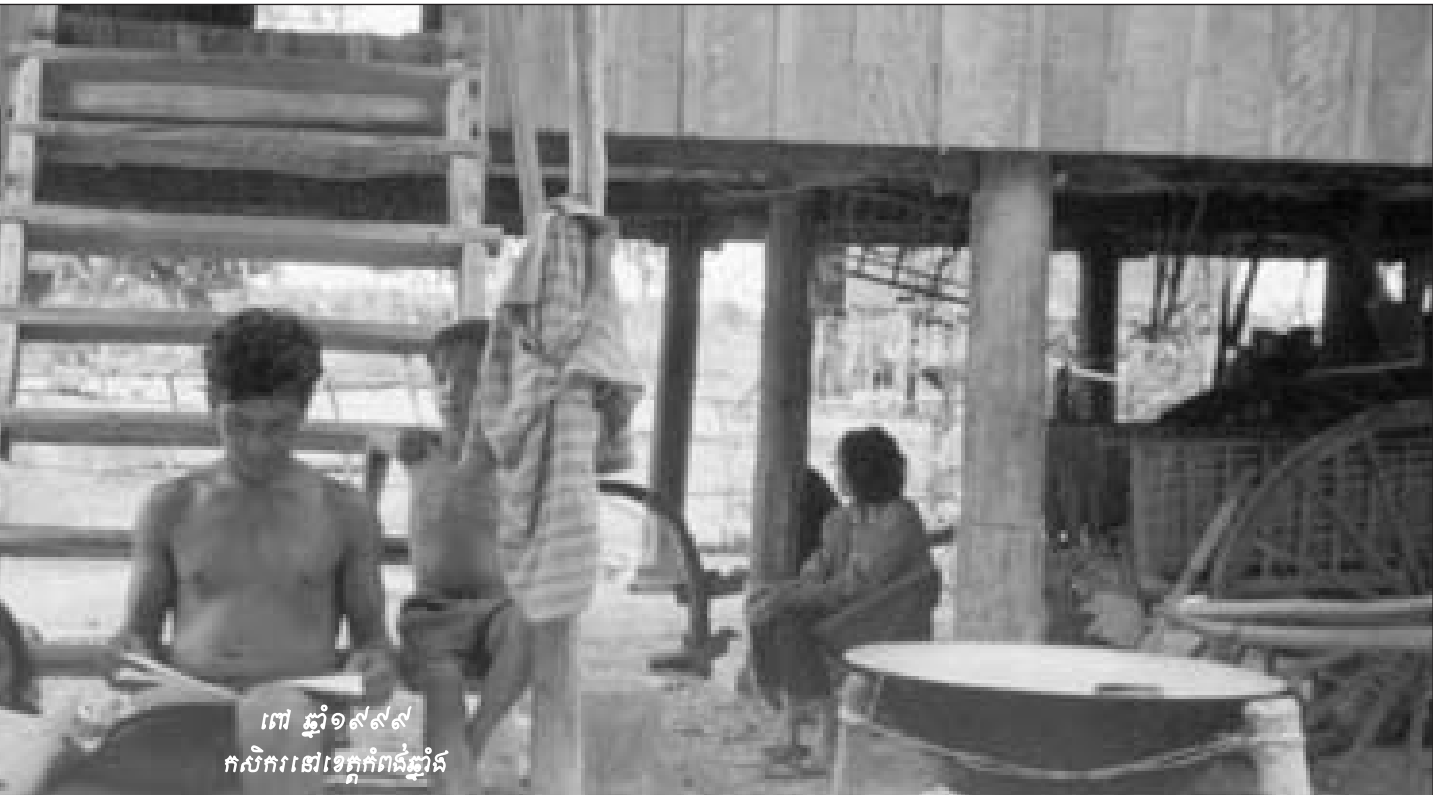
៣៧ ឆ្នាំ១៩៧៧ កសិករនៅខេត្តកំពង់ឆ្នាំង

យើងទាំងអស់គ្នាដែលជាជនរងគ្រោះនៃប្រវត្តិសាស្ត្រពិភពលោក ការស្វែងរកយុត្តិធម៌គឺជាភាគពុករលួយរបស់យើងម្នាក់ៗ ។ ខ្ញុំក៏ដូចជាជនរងគ្រោះនៃរបបខ្មែរក្រហមទាំងអស់គ្នាសង្ឃឹមថា អង្គការសហប្រជាជាតិនឹងរាជរដ្ឋាភិបាលកម្ពុជានឹងមិនបណ្តែតបណ្តោយឲ្យប្រវត្តិសាស្ត្រដ៏ខ្មៅងងឹតនេះបន្តគ្របដណ្តប់លើជនរងគ្រោះកម្ពុជាដែលជាដៃគូមួយនៃប្រវត្តិសាស្ត្រពិភពលោកឡើយ ។ ប្រសិនបើប្រការនេះនឹងក្លាយជាការពិត តើនរណាជាអ្នកទទួលខុសត្រូវក្នុងការធ្វើឲ្យការទន្ទឹមរង់ចាំយុត្តិធម៌ពិតប្រាកដមួយដែលជាដូរនៃតម្លៃតបស្នងចំពោះការឈឺចាប់របស់ជនរងគ្រោះកម្ពុជាត្រូវខកចិត្តនោះ? ថ្លង សុភារិទ្ធ