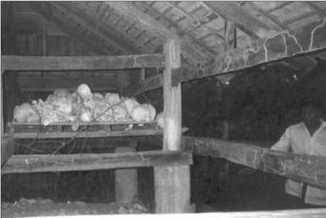
បូជនីយដ្ឋានវត្តប៉ប៊ី នៅភូមិប្រមុះជ្រូក ឃុំជ្រៃស ស្រុកកំពង់ត្រឡាច ខេត្តកំពង់ឆ្នាំង