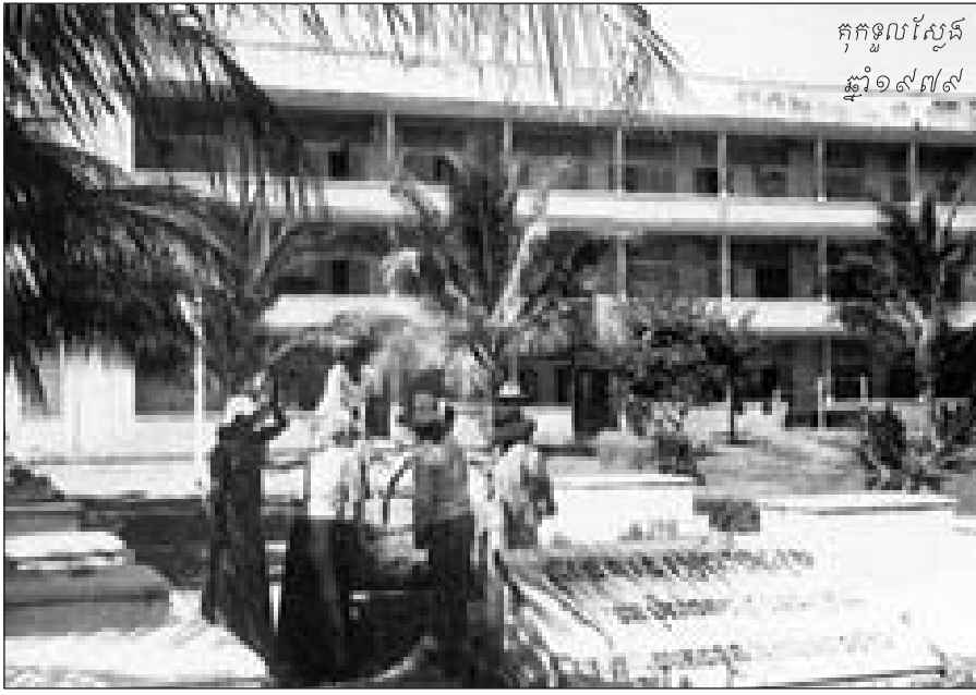
កុកខ្នុរស្នែង ឆ្នាំ១៩៧៧

ស្ត្រីទាំងនេះត្រូវបានបង្ខំឲ្យដើរតួយ៉ាង សាហាវយង់យួន ។ ពិបាកកំណត់ណាស់ ថាតើការជ្រើសរើសដោយសេរី ការ តាមសង្កត់ប្រហាក់ប្រហែលគ្នា ការគោរព បញ្ជា និងមហិច្ឆតា មានកម្រិតត្រឹម ណាទេ នៅក្នុងអ្វីដែលគេបានធ្វើកន្លង មក ។ អ្វីដែលយើងដឹងអំពីអ្នកធ្វើការ នៅមន្ទីរស-២១ ក្នុងករណីភាគច្រើនដូច ដែលការសិក្សាស្រាវជ្រាវរបស់លោក ប្រោននឹង បញ្ជាក់ស្រាប់ គឺភាពសាមញ្ញ និងភាពគ្មានខ្លឹមសាររបស់អ្នកធ្វើការនៅ ក្នុងមន្ទីរ ។ ដោយស្ថិតនៅជាមួយមនុស្ស