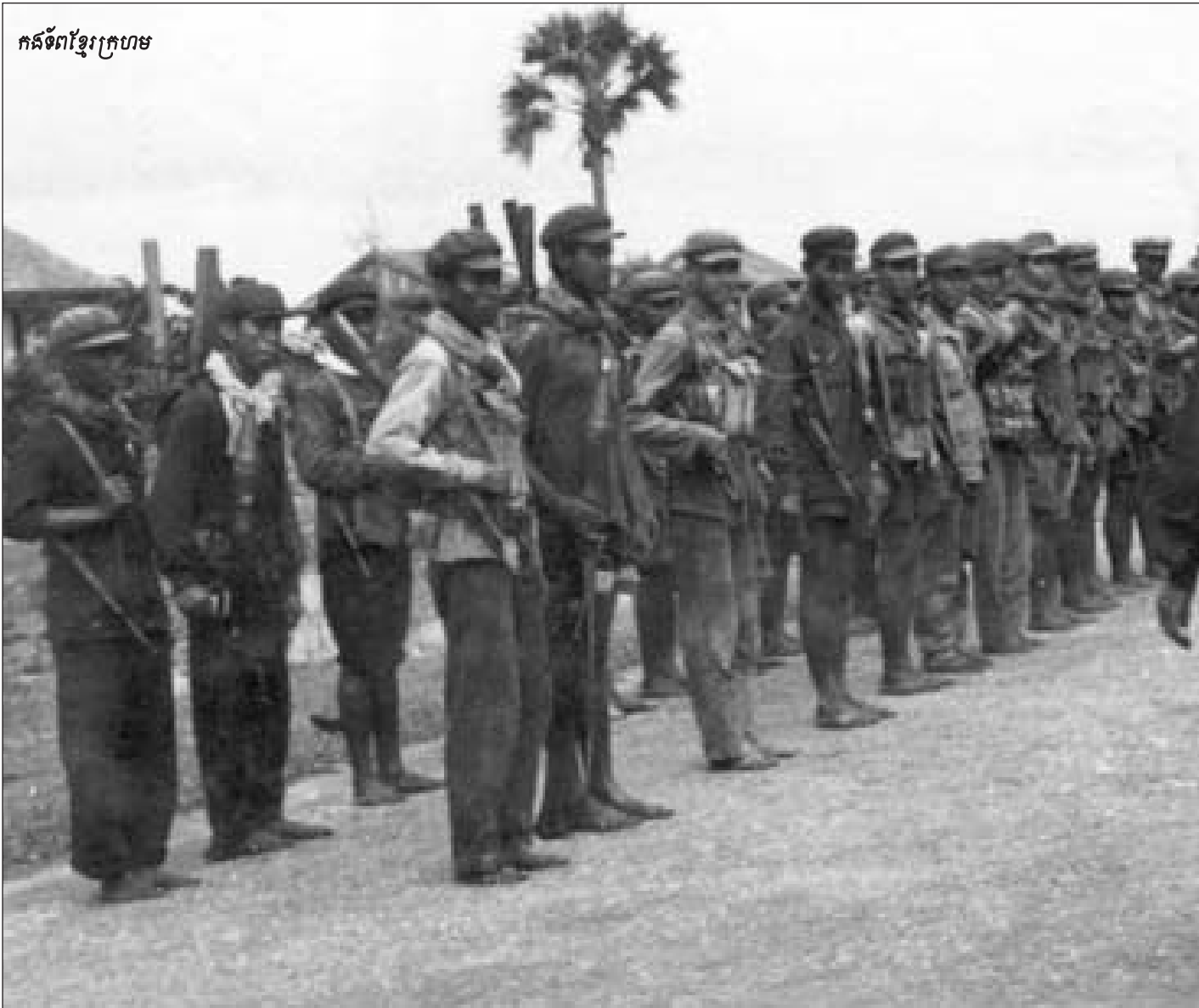
កងទ័ពខ្មែរក្រហម

ហេតុអ្វីបានជាកងកម្មាភិបាលប្រដាប់អាវុធយើងមានអំណាច ខ្លាំងម៉្លេះ? គឺដោយសារកម្មាភិបាលយោធាយើងខ្លាំង។ កម្មាភិបាលយោធាខ្លាំងធ្វើឲ្យយុទ្ធជនខ្លាំង ពីព្រោះយុទ្ធជនស្ថិត នៅក្រោមការដឹកនាំរបស់កម្មាភិបាល។ ហេតុអ្វីបានជាកម្មា- ភិបាលទាំងនេះខ្លាំងម៉្លេះ? ពីព្រោះគេជាកម្មាភិបាលយោធា ដែលត្រូវបានជ្រើសរើសយ៉ាងត្រឹមត្រូវតាមមតិរបស់បក្ស និងជាអ្នកអនុវត្តមតិកម្មាភិបាលបរិសុទ្ធ។ កម្មាភិបាលទាំងនេះ ពិតជាមានអំណាចខ្លាំងណាស់។ គេមានអំណាចខ្លាំងប៉ុន្តែមិន ដែលចូលប្រឡូកក្នុងសមរម្យដោយគ្មានរៀបចំផែនការ ច្បាស់លាស់នោះទេ។ កម្មាភិបាលទាំងនេះមានអំណាច ហើយ