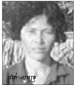
ដាត់ សមុទ្រ

យកចិត្តទុកដាក់ទេ ពីព្រោះ ឆ្លើយហត់នឹងការងារ ហើយ កាត់តែងគេចទៅសម្រាកដើម្បី យកកម្លាំងវែកដីពេលរសៀល ទៀត។ សូរ ចំរើន ក៏បាននិយាយ ដែរថា កាត់រៀនមួយថ្ងៃបានមួយ