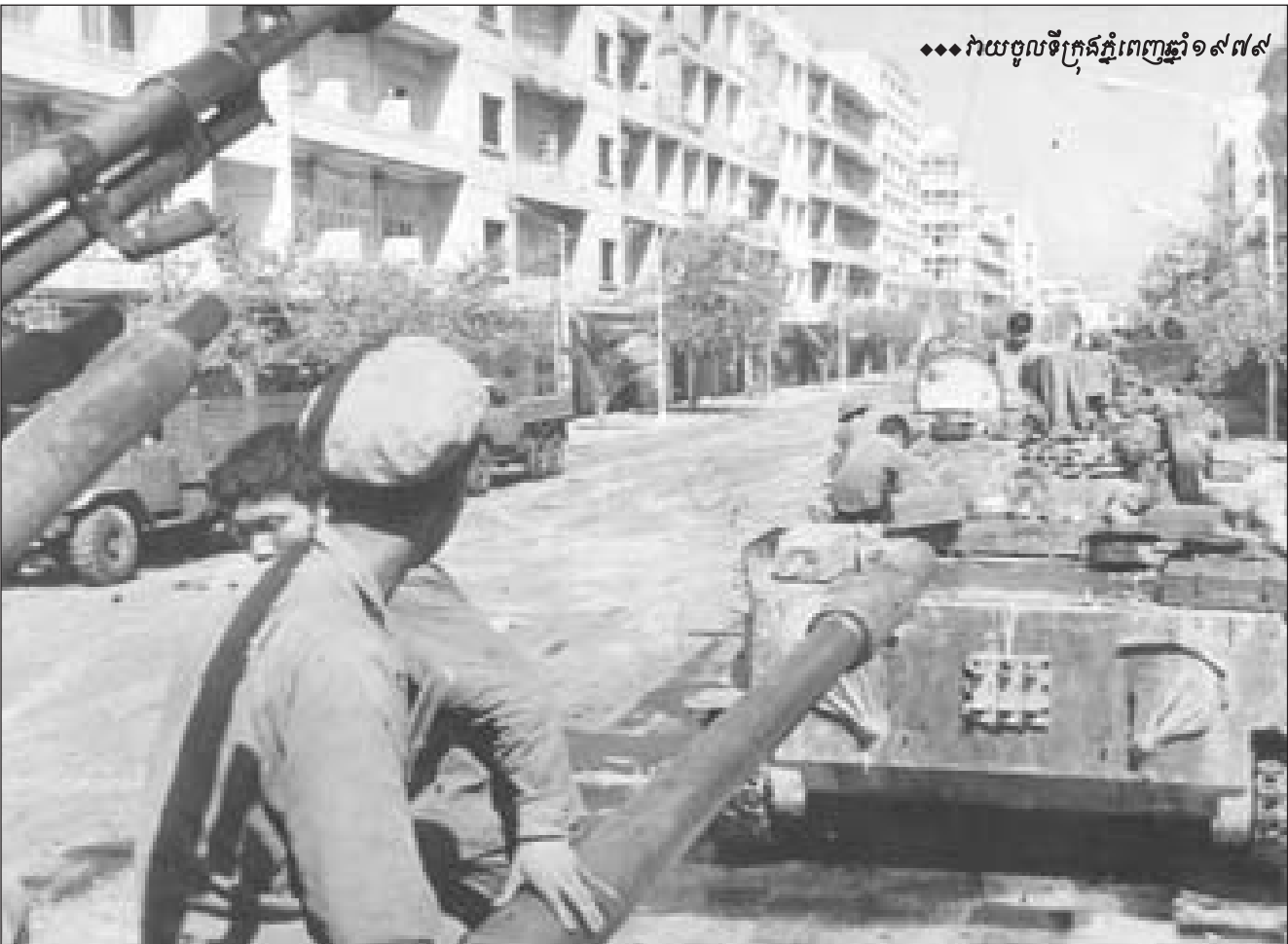
◆◆◆ វាយចូលទីក្រុងភ្នំពេញឆ្នាំ១៩៧៩