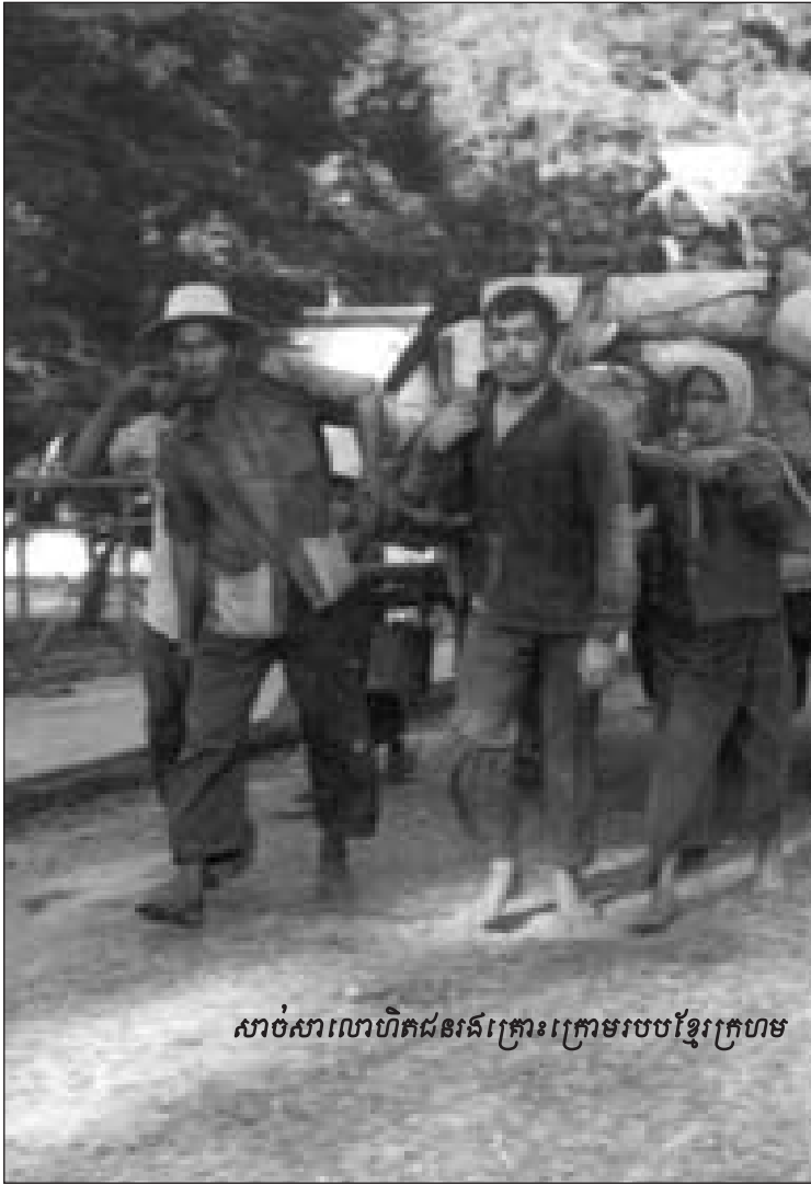
សាច់សាលាហិតជនរងគ្រោះក្រោមរបបខ្មែរក្រហម

យប់មួយនាឆ្នាំ១៧៧ នៅឯសហករណ៍កោះដុំ ពេល ដែលមនុស្សទាំងអស់ក្នុងសហករណ៍កំពុងតែប្រជុំជុំវិញភាព ស្រាប់តែមានភាពងឿលឆោឆោដោយសារមានមនុស្សព្រៃមក ចាប់ក្មេងយកទៅ ។ បន្ទាប់ពីឈ្នួបព័ទ្ធជាប់បាន ជនល្មើសបាន សារភាពថា ពីមុនខ្លួនជាកងទ័ពរំដោះ ហើយនៅក្រោយថ្ងៃ