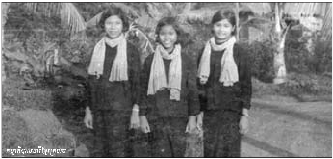
កម្មាភិបាលនារីខ្មែរក្រហម

ក) ដណ្តើមយកនារីឲ្យបានកុះករសម្រាប់ធ្វើបដិវត្តន៍ឲ្យ បានជោគជ័យលើខ្មាំង បក្សចាំបាច់ខកខានមិនបាននូវការធ្វើ ការងារកៀងគរនារី ។ ការងារកៀងគរនារី«តាមមតិវណ្ណៈ» ត្រូវធ្វើ÷