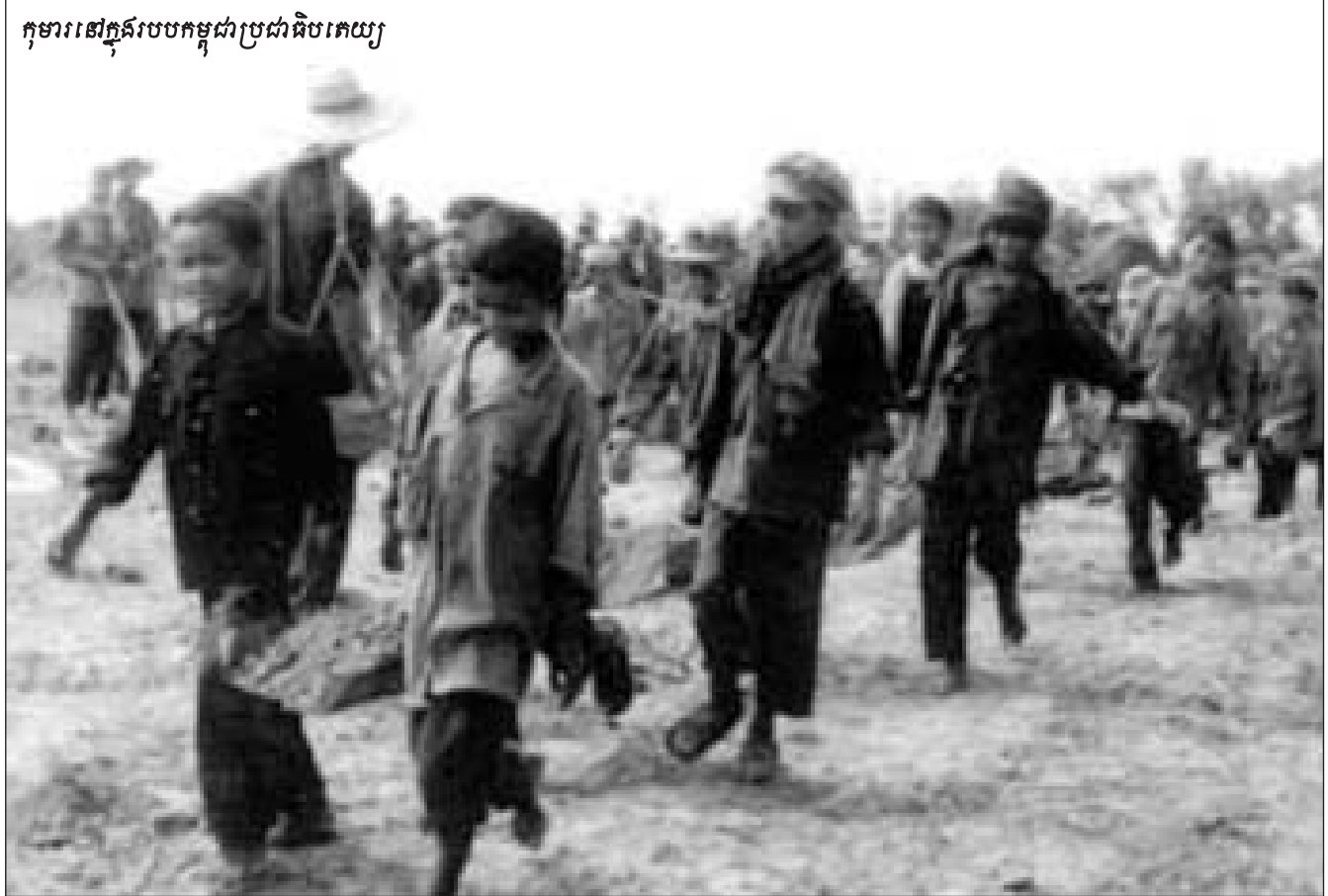
កុមារនៅក្នុងរបបកម្ពុជាប្រជាធិបតេយ្យ

ថ្នាក់ទី១មានសៀវភៅរៀនអក្សរនិងរៀនលេខ ។ នៅ ក្នុងសៀវភៅរៀនអក្សរដែលបោះពុម្ពនៅឆ្នាំ១៩៧៦ ដោយ របបកម្ពុជាប្រជាធិបតេយ្យ មាន១០៨ទំព័រ ចែកជា៣ផ្នែក ផ្នែកទី១មាន៤៦មេរៀន គឺរៀនអំពីស្រះ ព្យញ្ជនៈ និងរបៀប ប្រកប ផ្នែកទី២មាន១មេរៀនគឺរៀនអំពីវេយ្យាករណ៍ ផ្នែក ទី៣មាន១៥មេរៀន មានមេរៀននិងកំណាព្យដែលមានទិសដៅ អប់រំឲ្យកុមារស្រឡាញ់បង្កើតនូវ គោរពស្រឡាញ់អង្គការនិងខិតខំ ធ្វើការងារកសិកម្ម ។ សម្រាប់ថ្នាក់ទី១នេះ ក៏មានសៀវភៅរៀន លេខដែលបោះពុម្ពដោយក្រសួងសិក្សាធិការកម្ពុជាប្រជាធិប- តេយ្យនៅឆ្នាំ១៩៧៦ដែរ ។ សៀវភៅរៀនលេខថ្នាក់ទី១ ភាគ១ មានកម្រាស់៥៣ទំព័រ ចែកចេញជា២២មេរៀន ដែលរៀនអំពី