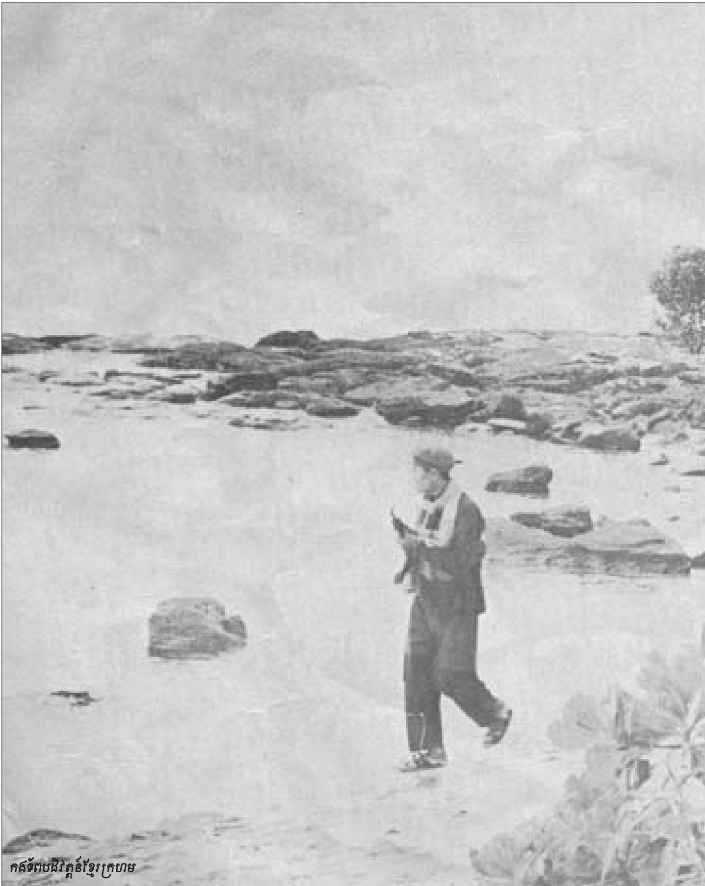
កងទ័ពបដិវត្តន៍ខ្មែរក្រហម