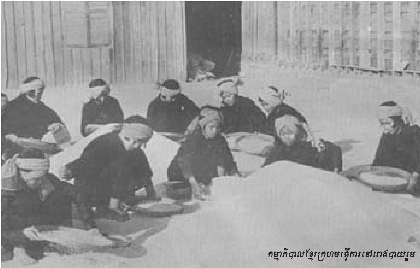
កម្មាភិបាលខ្មែរក្រហមធ្វើការនៅរោងបាយរួម