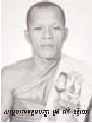
សម្តេចព្រះឧត្តមបញ្ញា ដួង ផង់ នន្ទិយោ

សំណួរ: ខ្ញុំព្រះករុណាសូមសួរ ទាក់ទងទៅនឹងរឿងតុលាការខ្មែរ ក្រហមដែលដំណើរការជាច្រើន ឆ្នាំកន្លងមកនេះ តើសម្តេចទ្រង់ ព្រះតម្រិះយ៉ាងណាដែរ?