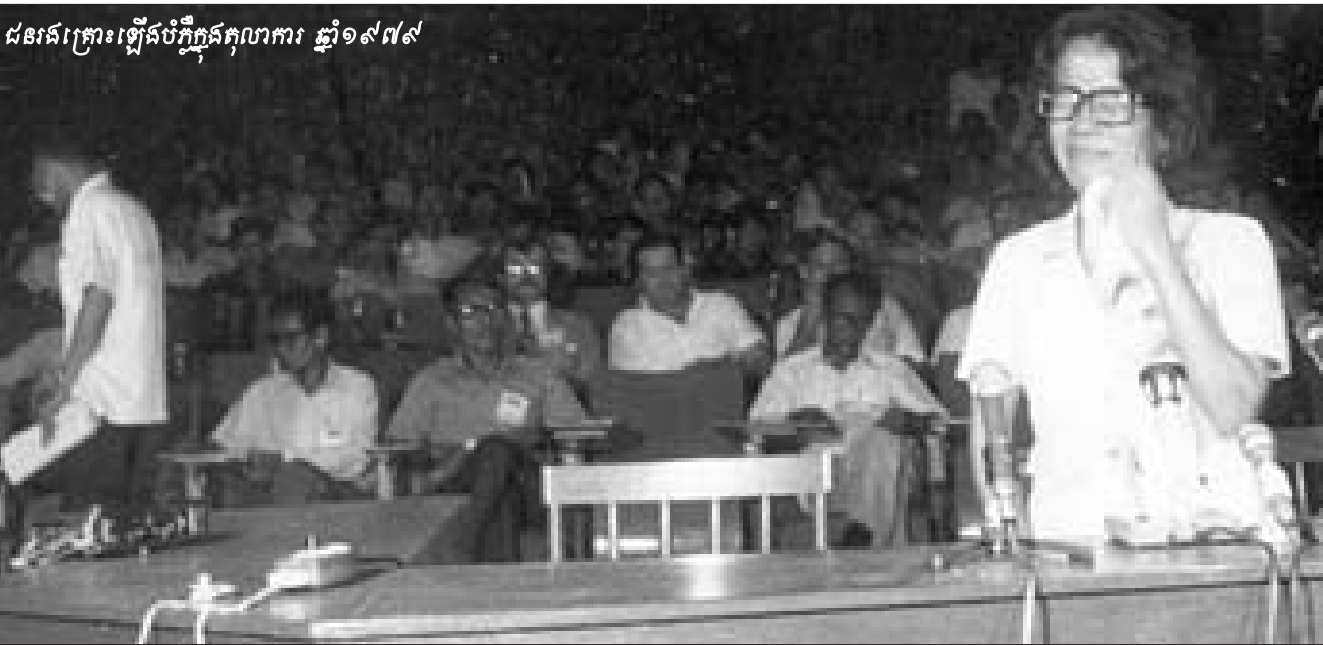
ជននៃគ្រោះឡើងបំភ្លឺក្នុងតុលាការ ឆ្នាំ១៩៧៩

ដោយដឹងពីសារសំខាន់នៃសាក្សី និងភាពចាំបាច់ខានមិនបានរបស់ជននៃគ្រោះនិងសាក្សី ច្បាប់លក្ខន្តិកៈផ្តល់អាណត្តិដល់ក្រុមបញ្ជីរបស់តុលាការព្រហ្មទណ្ឌអន្តរជាតិ ក្នុងការបង្កើតនូវអង្គភាពជននៃគ្រោះនិងសាក្សីនៅក្នុងការិយាល័យក្រុមបញ្ជីដើម្បីការពារនិងផ្តល់នូវសេវាកម្មប្រឹក្សាដល់ជននៃគ្រោះនិងសាក្សីតាមការចាំបាច់ជាក់ស្តែង ។ ដោយសារដល់ប៉ះពាល់នៃជម្លោះប្រដាប់អាវុធទៅលើស្ត្រីនិងកុមារត្រូវបានផ្តោតការយក