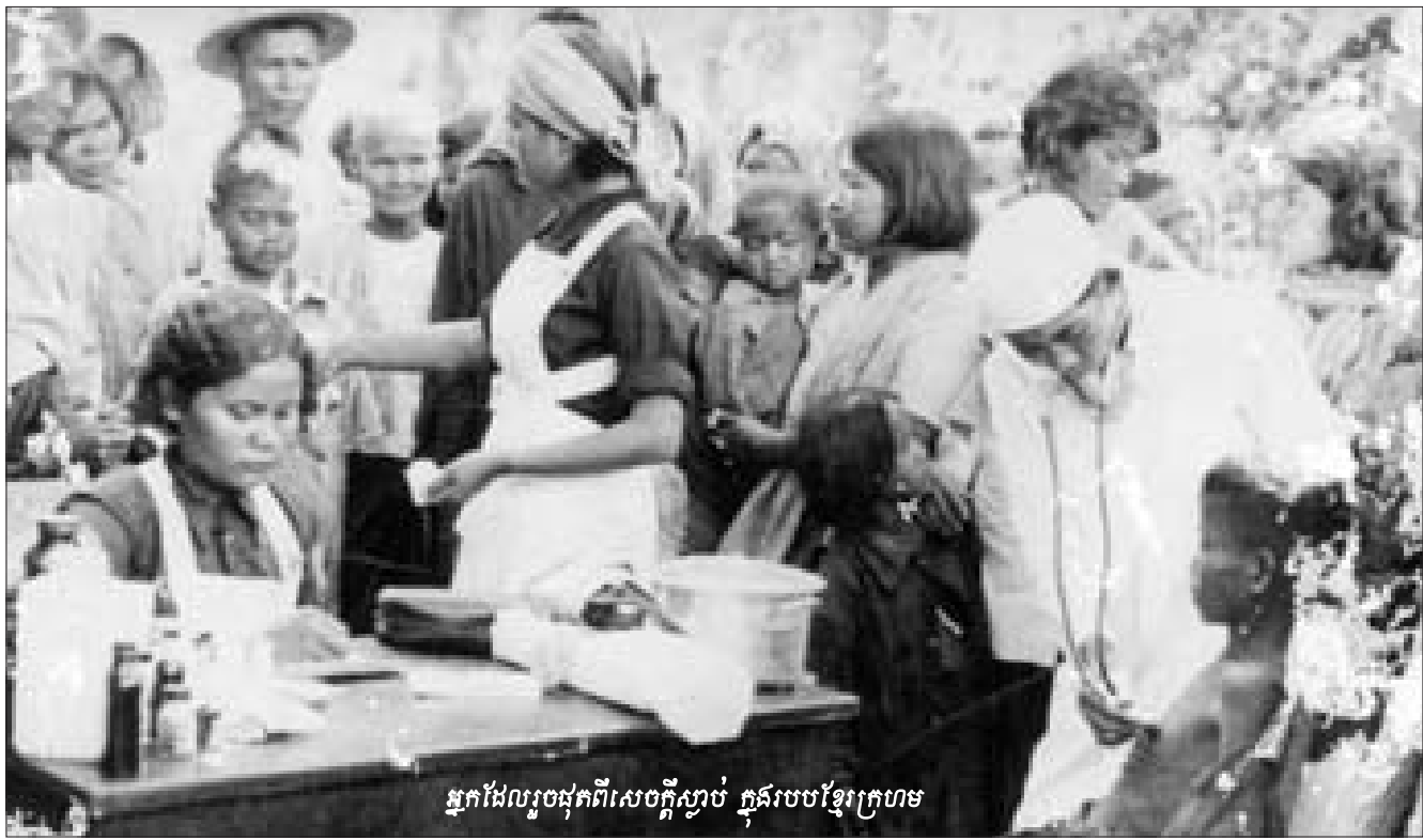
អ្នកដែលរួចផុកពីសេចក្តីស្លាប់ ក្នុងរបបខ្មែរក្រហម