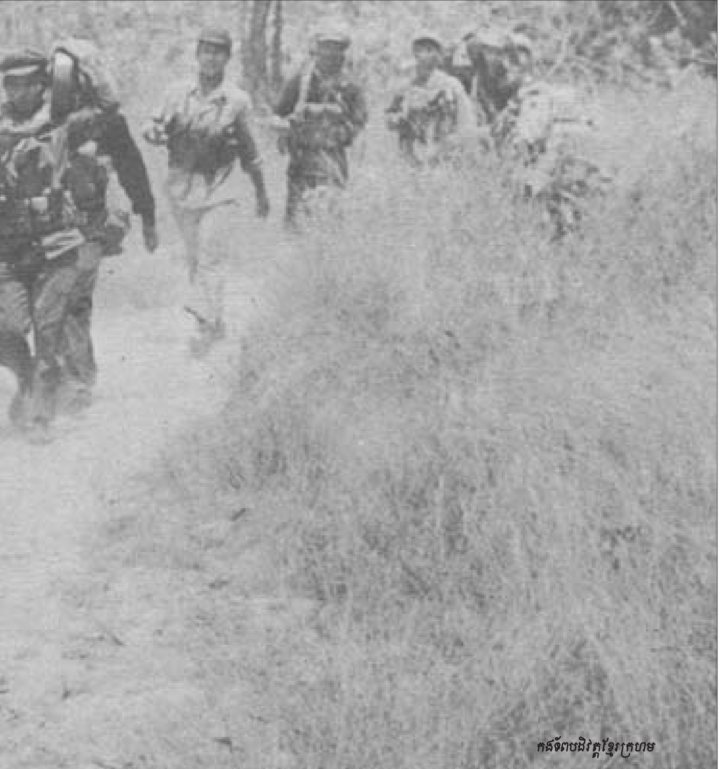
កងទ័ពបដិវត្តខ្មែរក្រហម

មានរឿង ស្រី ស្រា ល្បែងជាដើម ។ ចំពោះស្រីនិងល្បែងឃើញ ថា អង្គការខ្មែរក្រហមដោះស្រាយបានពិតប្រាកដមែន ជាមួយ នឹងអំពើលួចឆក់ប្លន់ផ្សេងៗ ។ ចំណែកគ្រឿងស្រវឹងនៅមាន សេសសល់ខ្លះៗ តែអង្គការខ្មែរក្រហមបានដោះស្រាយបំបាត់