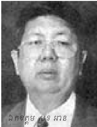
ឯកឧត្តម សុខ អាន