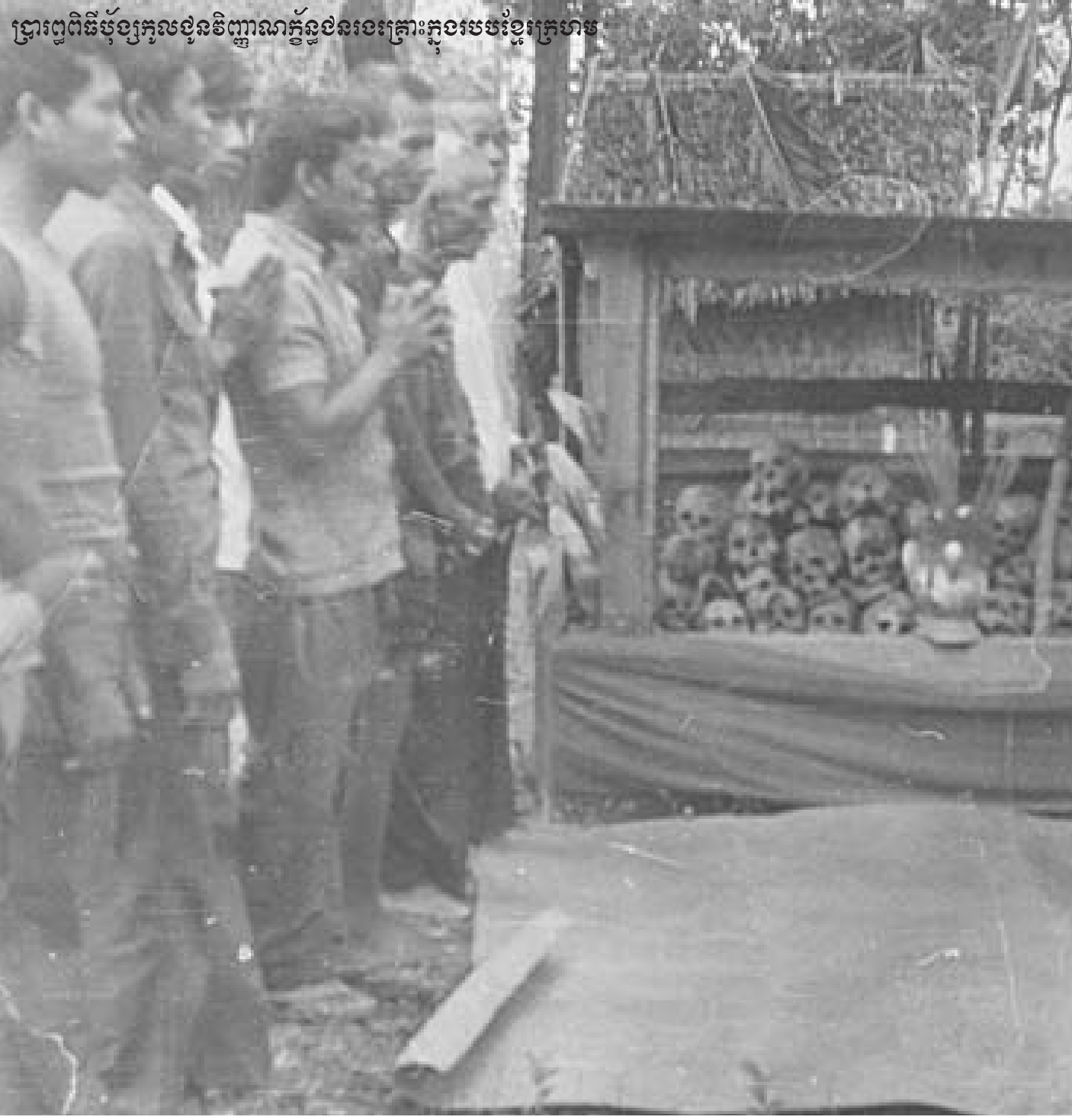
ប្រារព្ធពិធីប្តូរច្រករូងខ្លួននិព្វាណក្នុងខ្លួនគ្រោះក្នុងរូងខ្លួនខ្មែរក្រហម

ប្រព័ន្ធពេលនោះ ប្រជាជនកម្ពុជានឹងទទួលស្គាល់ថានេះជាការពិត មិនខាន ។ ការពិតអំពីអ្វីដែលមនុស្សអាចធ្វើចំពោះមនុស្សម្នាក់ ទៀត នឹងធ្វើឲ្យយើងមានអារម្មណ៍តូចស្បើយលែងខ្លាចខ្លាច ហើយធ្វើឲ្យចង់ស្តាប់នូវការនិយាយកាន់តែលម្អិតអំពីសារជាតិ របស់យើង ។ ចំពោះកម្មវិធីសិក្សាស្រាវជ្រាវរបស់មជ្ឈមណ្ឌល