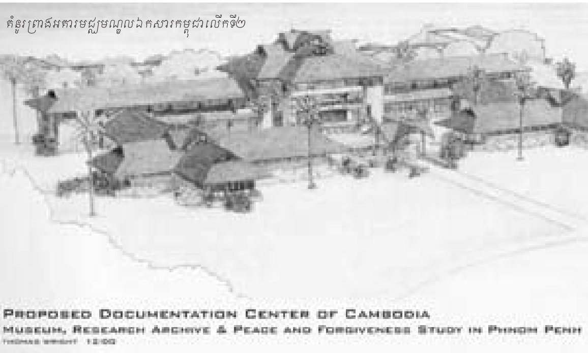
គំនូរព្រាងអគារមជ្ឈមណ្ឌលឯកសារកម្ពុជាលើកទី២

បេសកកម្មមួយរបស់មជ្ឈមណ្ឌលឯកសារកម្ពុជានៅពេលអនាគតគឺបន្តការងារប្រមូលនិងចងក្រងឯកសារទាក់ទងនឹង