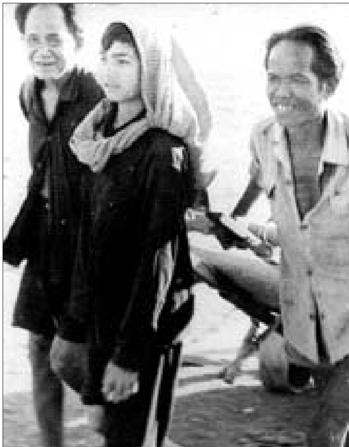
ក្រោយពីរបបខ្មែរក្រហមដួលរលំ ប្រជាជនវិលត្រឡប់ទៅលំនៅឋានវិញ ១៩៧៧