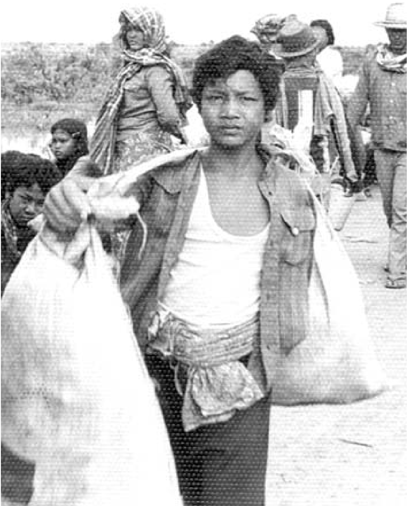
ក្រោយពីរបបខ្មែរក្រហមដួលរលំ ប្រជាជនវិលត្រឡប់ទៅស្រុកកំណើតវិញ ១៩៧៧