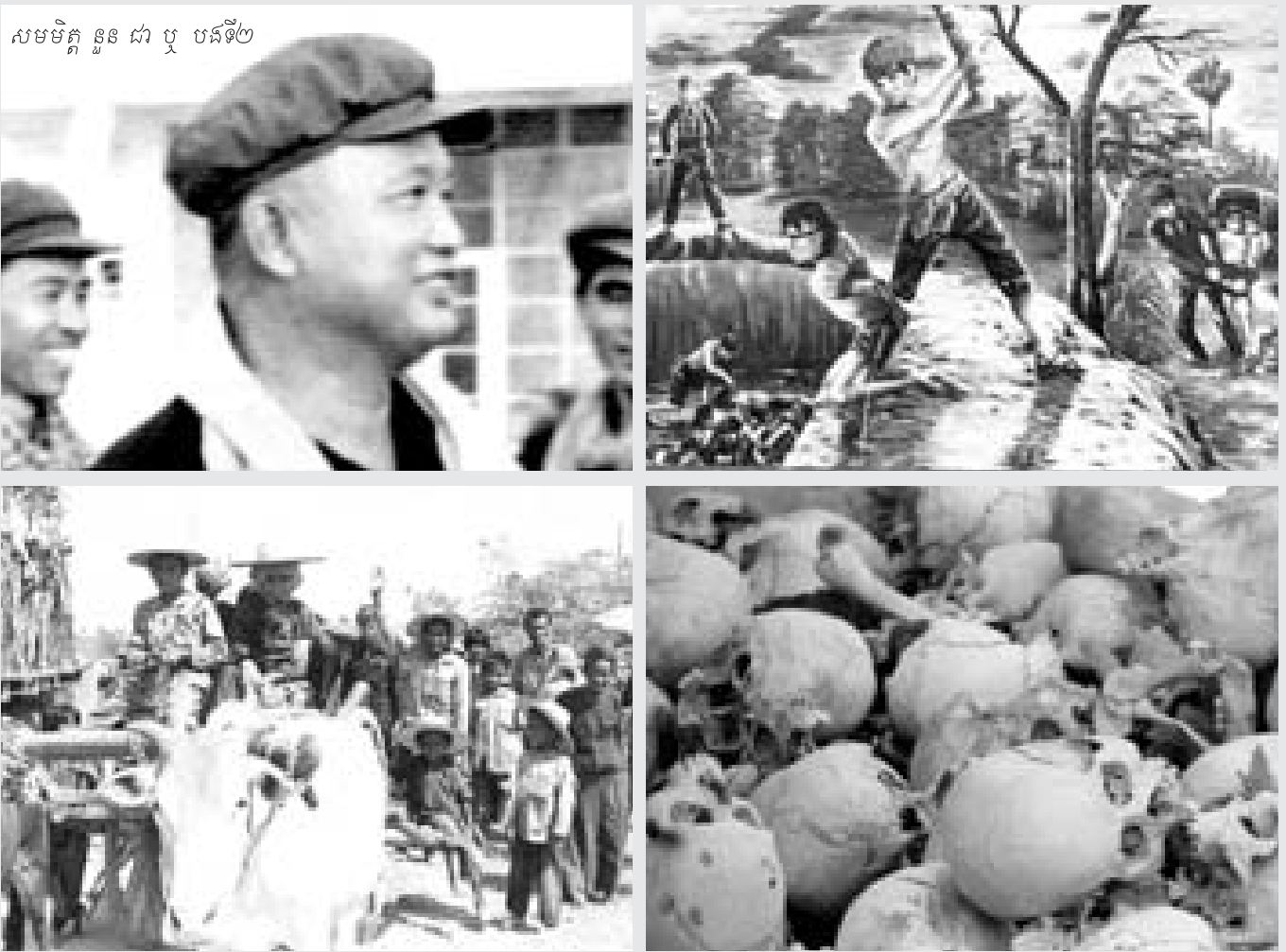
សមមិត្ត នួន ថា ឬ បងទី២