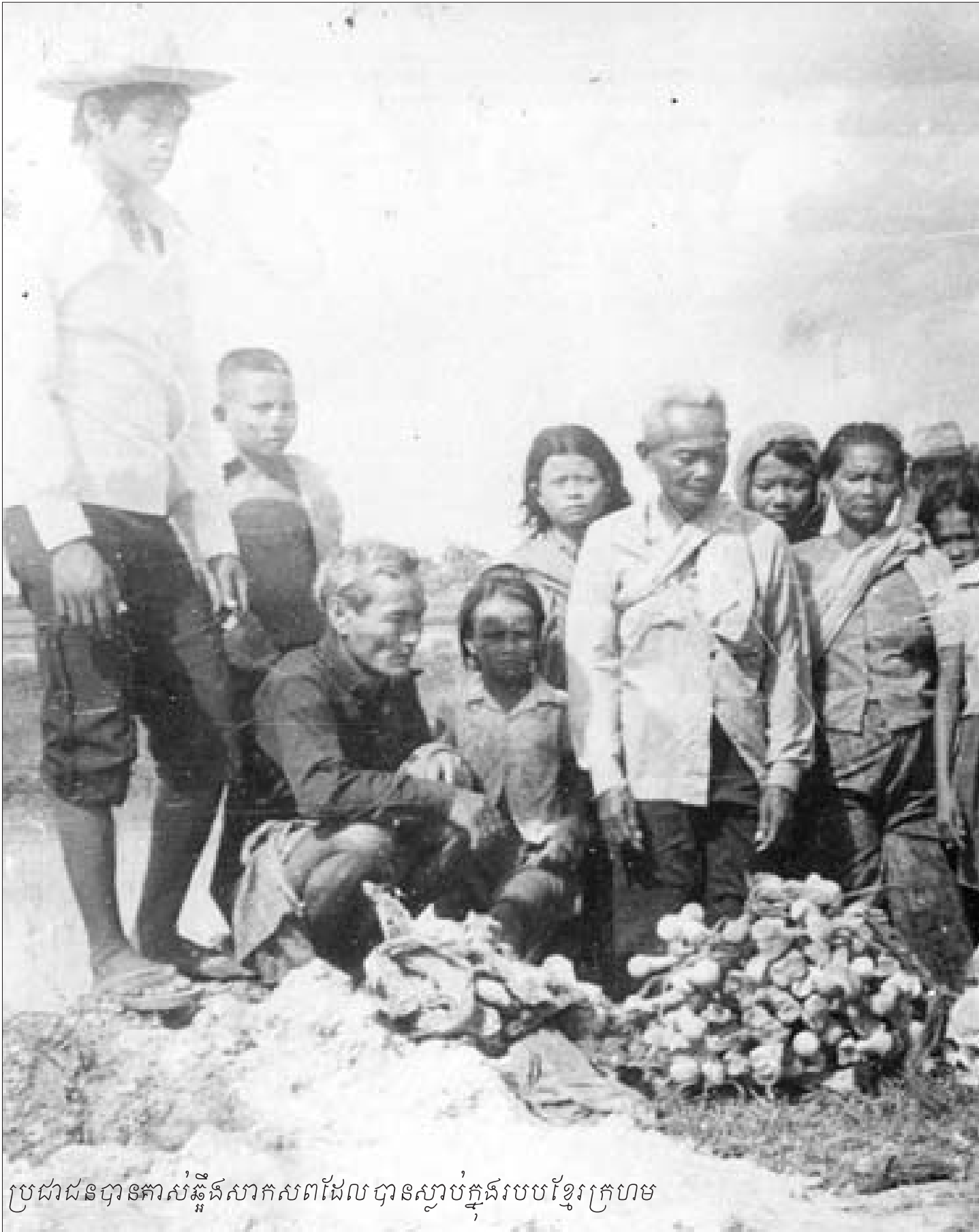
ប្រជាជនបានកាន់ស្រូវសាកសពដែល បានស្លាប់ក្នុងរបបខ្មែរក្រហម