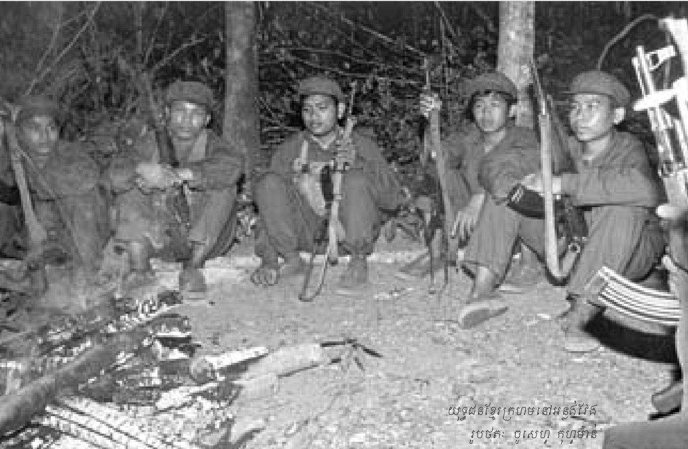
យុទ្ធជនខ្មែរក្រហមនៅអន្លង់វែង