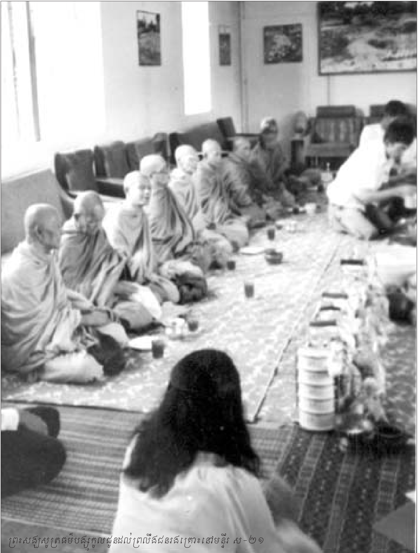
ព្រះសង្ឃស្នងការកេរកិច្ចជួបជុំដល់ព្រលឹងជនរងគ្រោះនៅមន្ទីរ ស-២១