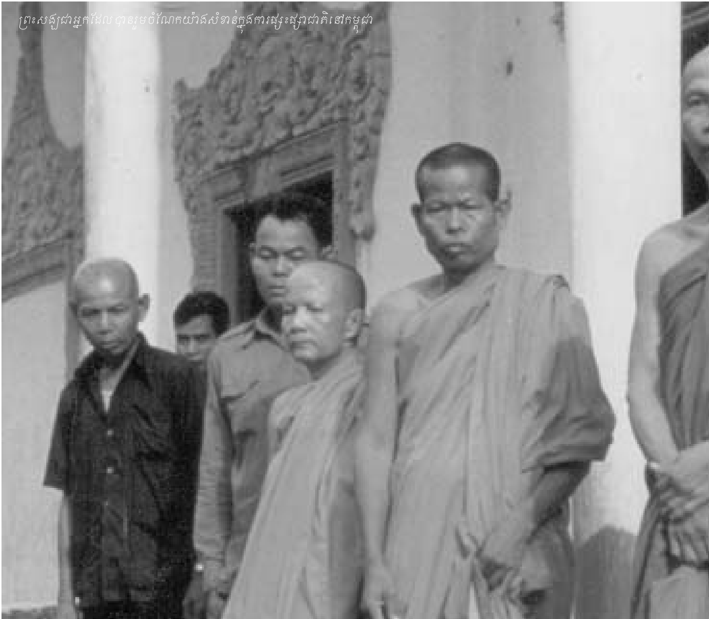
ព្រះសង្ឃជាអ្នកដែលបានរួមចំណែកយ៉ាងសំខាន់ក្នុងការផ្សះផ្សាជាតិនៅកម្ពុជា

ដែលត្រូវគេបង្ខំឲ្យបិទមាត់មិននិយាយពីអតីតកាល ឬជនរងគ្រោះត្រូវបានដាក់ឲ្យស្ថិតនៅក្រៅសង្គម ឬត្រូវបានបង្ខំឲ្យនៅស្ងៀមដោយខ្លាចថាមានការបង្ខំរាយមបនៃមនោវិទ្យា។ ទោះបីជារដ្ឋាភិបាលមិនយកចិត្តទុកដាក់ចំពោះរឿងខ្មែរក្រហម ហើយពុំសូវមានការពិភាក្សារវៃកញ្ញាជាសាធារណៈក្តី ក៏ប្រជាជនខ្មែរបានជជែកអំពីអ្វីដែលបានកើតឡើងនៅក្នុងរបបកម្ពុជាប្រជាធិបតេយ្យតាំងពីឆ្នាំ១៩៧៧មកម៉្លេះ ដោយមានការការព្រះខ្លះពីរដ្ឋដើម្បីបម្រើដល់ប្រយោជន៍នយោបាយ ដូចជាការបង្កើត «ទិវាចងកំហឹង» ជាដើម ។