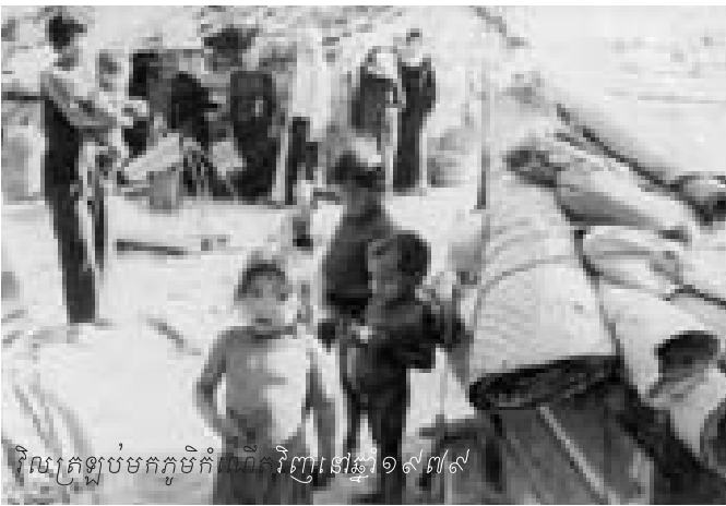
វិលត្រឡប់មកភូមិកំណើតវិញនៅឆ្នាំ១៩៧៧