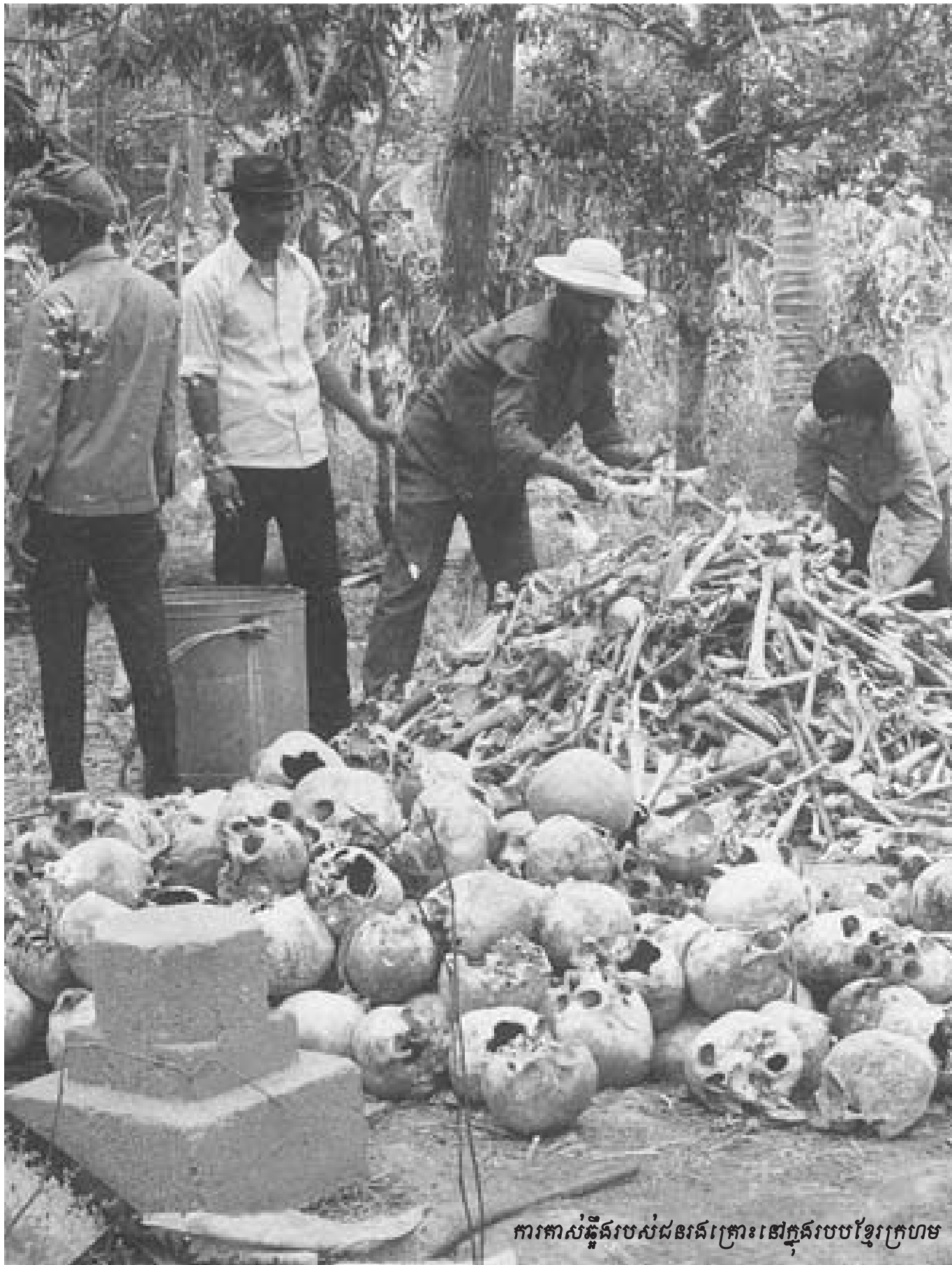
ការកាត់កូនរបស់ជនរងគ្រោះនៅក្នុងរបបខ្មែរក្រហម