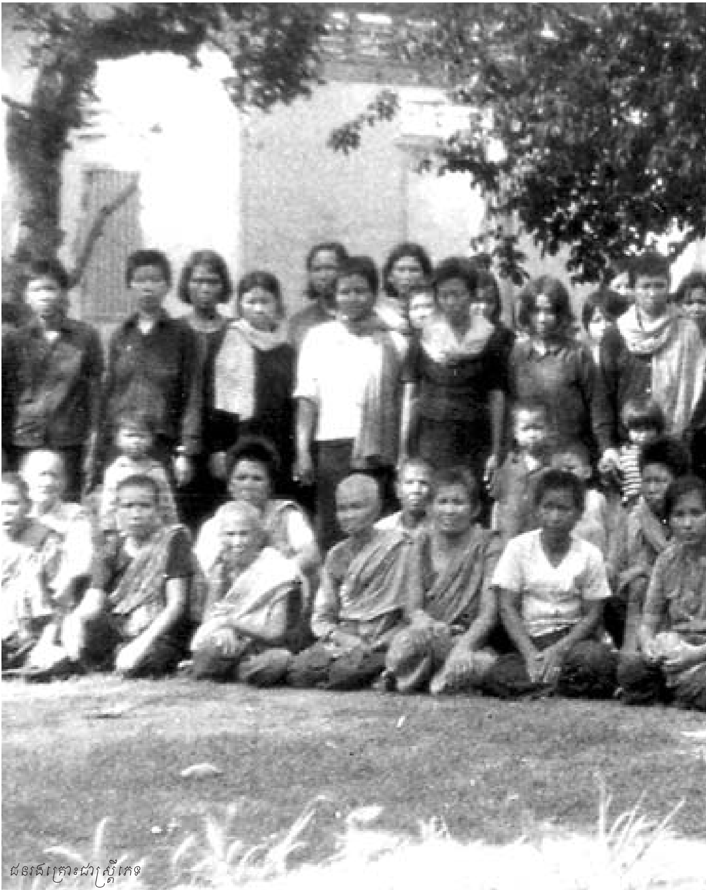
ជនរងគ្រោះជាក្រសួងភ្នំពេញ