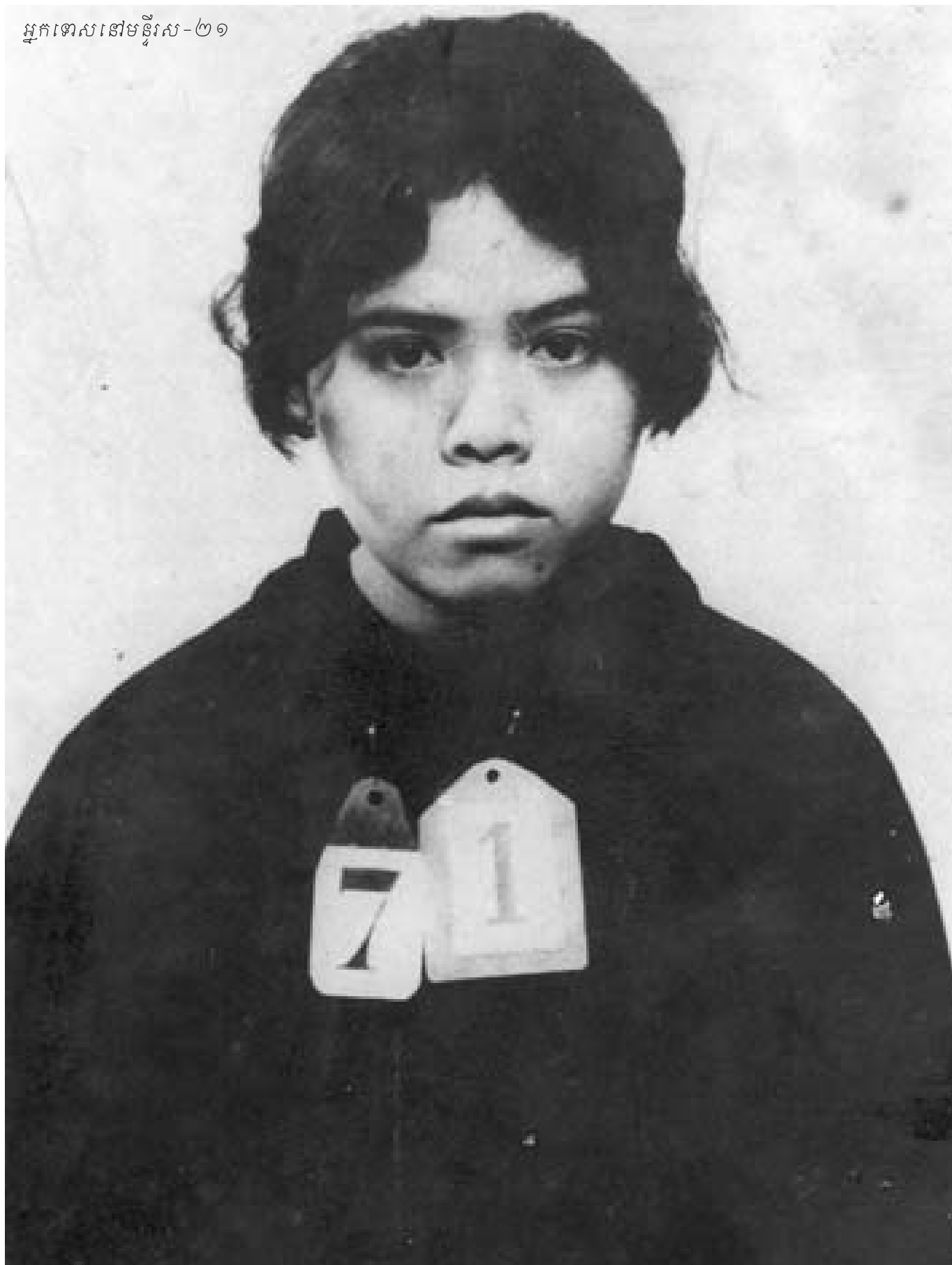
អ្នកទោសនៅមន្ទីរស-២១