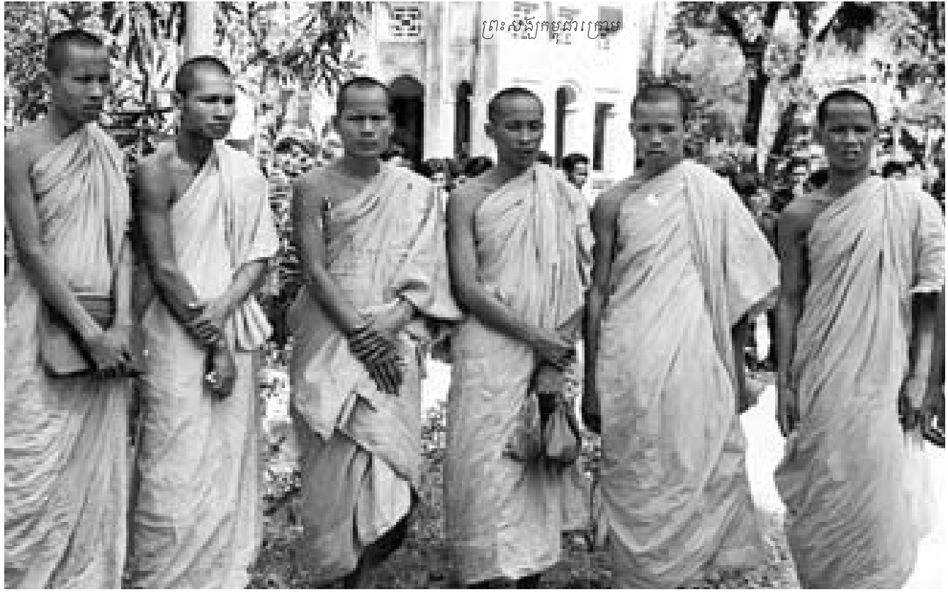
ព្រះសង្ឃកម្ពុជាក្រោម