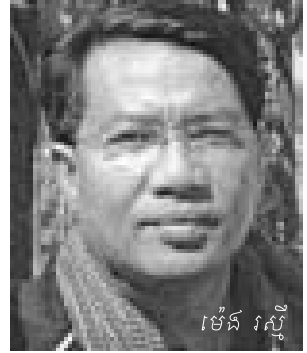
ម៉ែន រស្មី

ខ្ញុំបណ្តោយឲ្យអារម្មណ៍ហូរទៅតាមខ្សែទឹក ហើយជ្រមុជ ក្នុងនាំយកព្រឹត្តិការណ៍កាលពីឆ្នាំ១៩៧៧ គឺនៅពេលដែលកណៈ សហករណ៍ឃុំខ្ពបបញ្ជាឲ្យនាំខ្លួនខ្ញុំតាមទូកពីកងកុមារនៅតំបន់ទំនប់ ក្រាំងឃ្នុំ យកមកបញ្ចូលក្នុងកងចល័តយុវជនប្រចាំស្រុក២០ គឺក្រោយពេលដែលអង្គការស្នើយកឪពុកខ្ញុំទៅរៀនសូត្រនៅមន្ទីរ សន្តិសុខកោះថ្មី ។