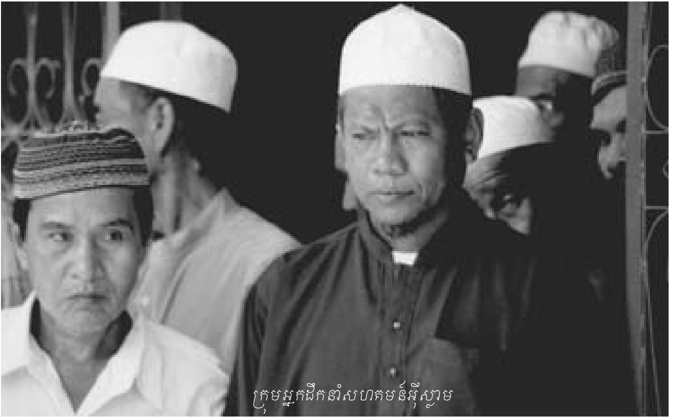
ក្រុមអ្នកដឹកនាំសហគមន៍អ៊ីស្លាម