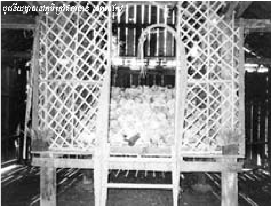
បូជនីយដ្ឋាននៅក្នុងគុកក្រាំងតាចាន់ រដ្ឋាករកែវ

ឥតក្របស ។ សែន ក៏ត្រូវខ្មែរ ក្រហមសម្លាប់នៅក្នុងគុកក្រាំងតាចាន់ ដែរ ។ សែន នៅចាំថា មុនពេលយក ឥតក្របសគាត់ទៅសម្លាប់ ពេជ្រយាត បានប្រើឲ្យ សែន ទៅរោងគោមួយនៅ ខាងលិចគុកដើម្បីទៅកើបអាចម៍គោ តែតាមការពិតពេលនោះ ឈ្មួញគ្រាន់ តែយកទឹកសនោះដើម្បីយកឥតក្របស របស់គាត់ទៅសម្លាប់តែប៉ុណ្ណោះ ។ សែន ត្រឡប់មកពីកើបអាចម៍គោវិញ ពេល ដែលពេជ្រយាតបានសម្លាប់ឥតក្របស និងអ្នកសាកសពទម្លាក់រណ្តៅរួចទៅ