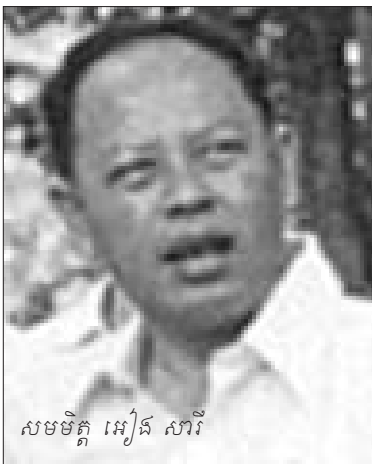
សមមិត្ត អៀង សារី

អ្នកយកសារព័ត៌មានម្នាក់បានសួរខ្ញុំថា តើខ្ញុំមានប្រតិកម្មយ៉ាងដូចម្តេចចំពោះសម្តីរបស់សមមិត្ត អៀង សារី ដែលបាននិយាយថា យុវជនយុវនារីជំនាន់ក្រោយដែលមានរូប