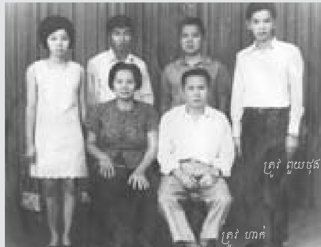
ត្រូវ ព្រួយមុន

ឥឡូវនេះ យើងមានគម្រោងសរសេរសៀវភៅថ្មីមួយក្បាលទៀតដែលរៀបរាប់អំពីដំណើររឿងរបស់ប្រជាជនថ្មីនៅក្នុងរបប កម្ពុជាប្រជាធិបតេយ្យ ។ ប្រសិនបើលោកអ្នកឬសាច់ញាតិណាម្នាក់របស់លោកអ្នកជាប្រជាជនថ្មី ហើយចង់រួមចំណែកចែករំលែក រឿងរ៉ាវនៅក្នុងសៀវភៅនេះ យើងនឹងទៅសម្ភាសលោកអ្នកដោយផ្ទាល់ ។ យើងសូមស្វាគមន៍ចំពោះការចូលរួមចំណែករបស់ ប្រជាពលរដ្ឋខ្មែរទាំងក្នុងនិងក្រៅប្រទេស ហើយដោយសារតែរូបថតទាំងនេះជាផ្នែកមួយដែលមានសារសំខាន់សម្រាប់សៀវភៅ