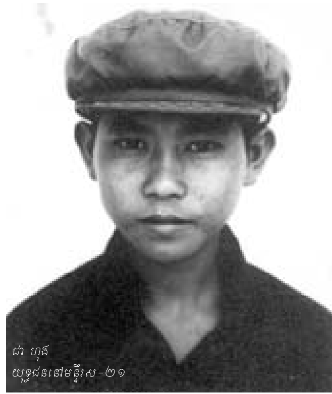
ជា ហុក យុទ្ធជននៅមន្ទីរស-២១

ការធានានូវសិទ្ធិរបស់ជនរងគ្រោះក្នុងការចូលរួមដំណើរការរបស់អង្គជំនុំជម្រះវិសាមញ្ញនឹងផ្តល់ឲ្យជនរងគ្រោះទាំងនោះនូវការយល់ដឹងកាន់តែទូលាយជាងមុនអំពី «ភាពជាកម្មសិទ្ធិ» នៃអង្គជំនុំជម្រះវិសាមញ្ញ និងធានាសិទ្ធិរបស់ជនរងគ្រោះទាំងនោះ