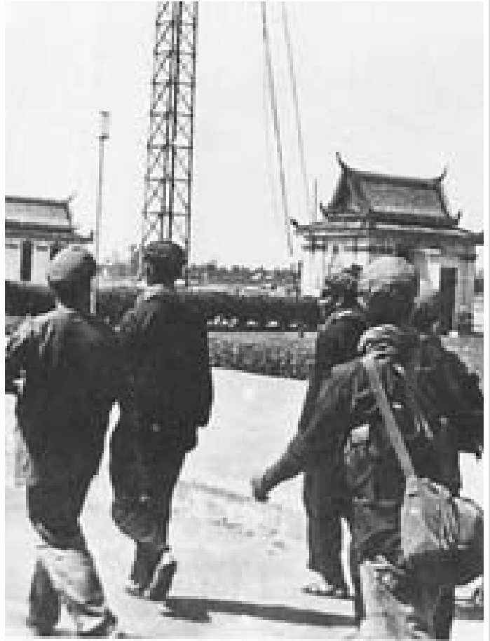
កងទ័ពខ្មែរក្រហមចូលទីក្រុងភ្នំពេញ នៅថ្ងៃទី១៧ ខែមេសា ឆ្នាំ១៩៧៥

◆ ត្រូវតែកាត់ទោសដើម្បីទុកជាមេរៀន..... ៦០