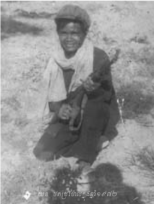
យន ថតប្រហែលក្នុងឆ្នាំ១៩៧២

ហើយសម្លាប់គាត់ចោលនៅទីនោះតែម្តង ។ មានមនុស្សប្រាប់ខ្ញុំ ថា ម្តាយខ្ញុំត្រូវអង្កការសម្លាប់នៅចម្ការអណ្តូងខេត្តកំពង់ចាម ។ ខ្មែរក្រហមចោទថាគាត់ជាអាមេរិកកាំងនិងយួន ។ អង្កការថែម ទាំងបានសម្លាប់ប្អូនប្រុសខ្ញុំពីរនាក់និងប្អូនស្រីអាយុ៧ឆ្នាំម្នាក់ទៀត ក្នុងពេលតែមួយជាមួយម្តាយខ្ញុំ ។ ក្រៅពីនោះ បងប្រុសខ្ញុំ បីនាក់ទៀតត្រូវអង្កការយកទៅសម្លាប់ចោលពេលដោយខ្សែកៗ ពីគ្នា ។