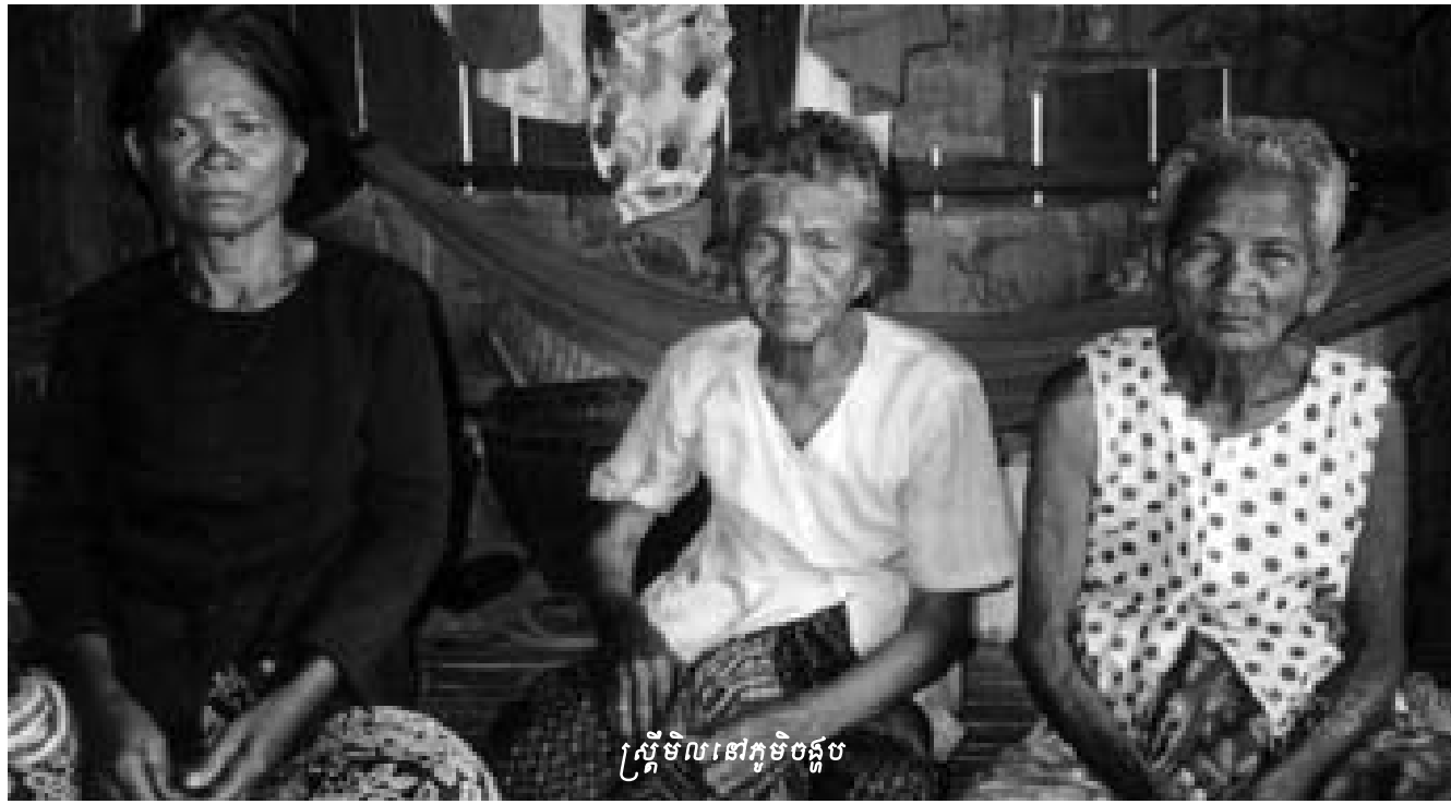
ស្ត្រីមិលនៅភូមិចត្តប

កក វ៉ិន ជនជាតិមិល អាយុ៥៧ឆ្នាំ ប្រាប់ថា គាត់បាន