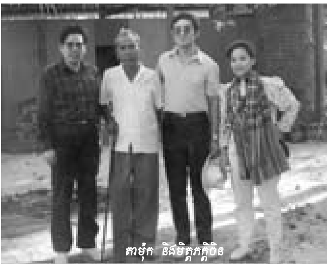
កាម៉ុក និងមិត្តភក្តិចិន

កម្ពុជានិងអង្គការសហប្រជាជាតិស្ទើរតែបញ្ចប់ជំហានបន្ទាប់របស់ខ្លួនក្នុងការប្រមូលថវិកាសម្រាប់រៀបចំបង្កើតអង្គជំនុំជម្រះវិសាមញ្ញនៅក្នុងតុលាការកម្ពុជា ។ អង្គការសហប្រជាជាតិប្រមូលថវិកាបានជាង៤១លានដុល្លារនៃថវិកាចំនួន៤៣លានដុល្លារដែលជាចំណែកទទួលខុសត្រូវរបស់សហគមន៍អន្តរជាតិ ។ រាជរដ្ឋាភិបាលកម្ពុជាជាអ្នកទទួលខុសត្រូវលើចំណែកថវិកាចំនួនជាង១៣លានដុល្លារជាសាច់ប្រាក់និងការចំណាយផ្សេងៗ ។ ប៉ុន្តែ កាលពីពេលថ្មីៗនេះ រាជរដ្ឋាភិបាលកម្ពុជាបានប្រកាសថា ខ្លួនអាចរួមវិភាគទានជាទឹកប្រាក់បានត្រឹមតែ១,៥លានដុល្លារប៉ុណ្ណោះ ។ រាជរដ្ឋាភិបាលកម្ពុជាបានអំពាវនាវសុំឲ្យប្រទេសជប៉ុន (ដែលជាប្រទេសមួយក្នុងចំណោមប្រទេសមួយចំនួនដែលបានស្នើសុំសេចក្តីសម្រេចចិត្តរបស់អង្គការសហប្រជាជាតិបង្កើតសាលាជំនុំជម្រះក្តីមេដឹកនាំខ្មែរក្រហម) ជួយទប់ទល់ចំពោះកង្វះខាតរបស់ខ្លួន ហើយប្រទេសជប៉ុនបានអនុញ្ញាតឲ្យរាជរដ្ឋាភិបាលកម្ពុជាប្រើ