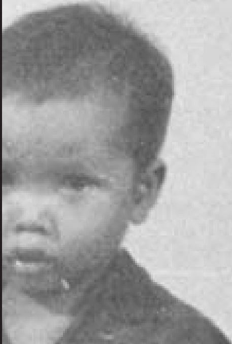
ជនរងគ្រោះ