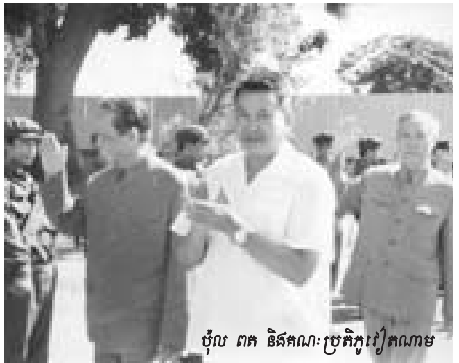
ប៉ុល ពត និងគណៈប្រតិភូរៀកណាម

សាលារៀន សាកលវិទ្យាល័យ វត្តអារាម វិហារអ៊ុំស្វាម វិហារសាសនាគ្រិស្ត ធនាគារនិងមុខជំនួញដូរទាំងអស់ ត្រូវ បានបិទទ្វារលែងឲ្យមានដំណើរការ ។ កម្ពុជាប្រជាធិបតេយ្យដែល ជំរុញដោយលទ្ធិម៉ៅនិយមមួយនេះបានលុបបំបាត់ចោលទាំង អស់នូវកម្មសិទ្ធិឯកជន សេរីភាពសាសនា សេរីភាពសារពត៌មាន សេរីភាពការបញ្ចេញយោបល់ និងសេរីភាពក្នុងការធ្វើដំណើរទៅ កន្លែងផ្សេងៗ ។ នៅពេលដែលប្រជាជនទាំងអស់ត្រូវបានជម្រុញ ចេញពីទីក្រុង ការសម្លាប់រដ្ឋាលដំណាក់កាលដំបូងបានចាប់ផ្តើម ។ ជនទាំងឡាយដែលជាប់ពាក់ព័ន្ធនឹងរបបសាធារណរដ្ឋខ្មែរ (របប លន់ណុល) គឺជាជនទីមួយដែលត្រូវស្លាប់ ។ ជនបន្ទាប់ទៀតដែល ជាមុខសញ្ញារបស់ខ្មែរក្រហមរួមមាន៖ អ្នកដែលខ្មែរក្រហមសន្មត