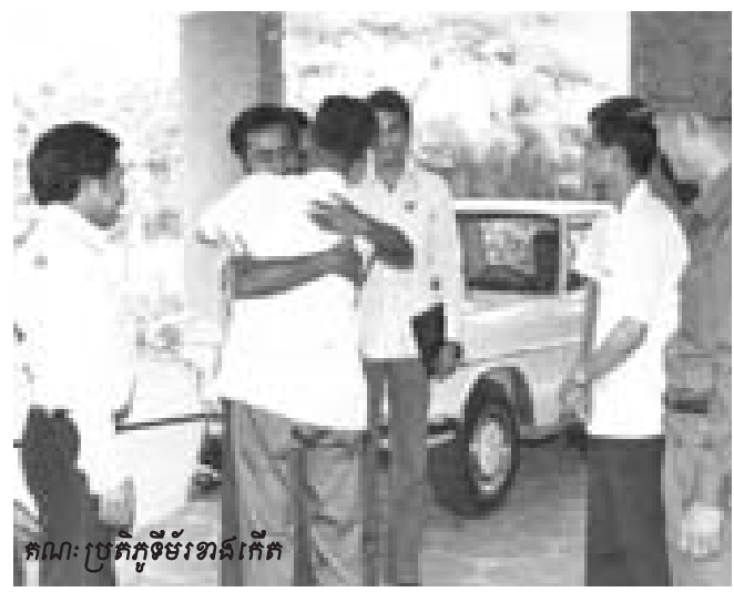
គណៈប្រតិភូទីម័រខាតកើត

ទិដ្ឋភាពដ៏គួរឲ្យចាប់អារម្មណ៍ផ្សេងទៀតរបស់ប្រវត្តិសាស្ត្រ