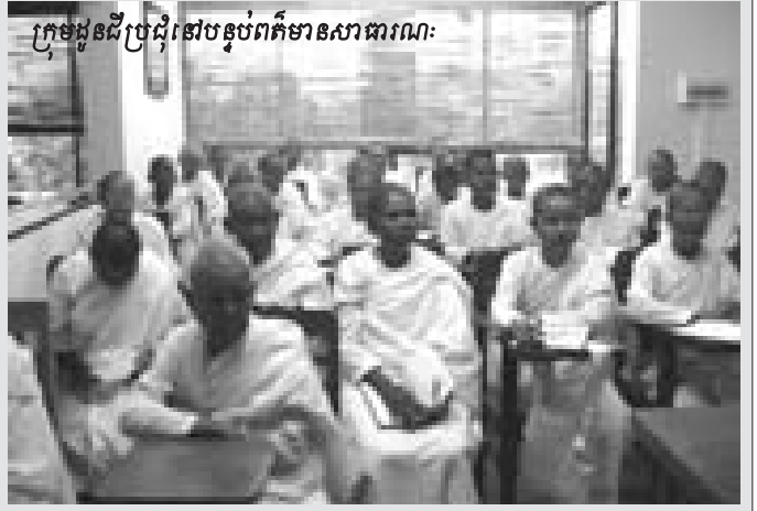
ក្រុមដូនជីប្រជុំនៅបន្ទប់ព័ត៌មានសាធារណៈ