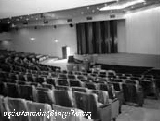
បន្ទប់សវនាការអង្គជំនុំជម្រះវិសាមញ្ញ