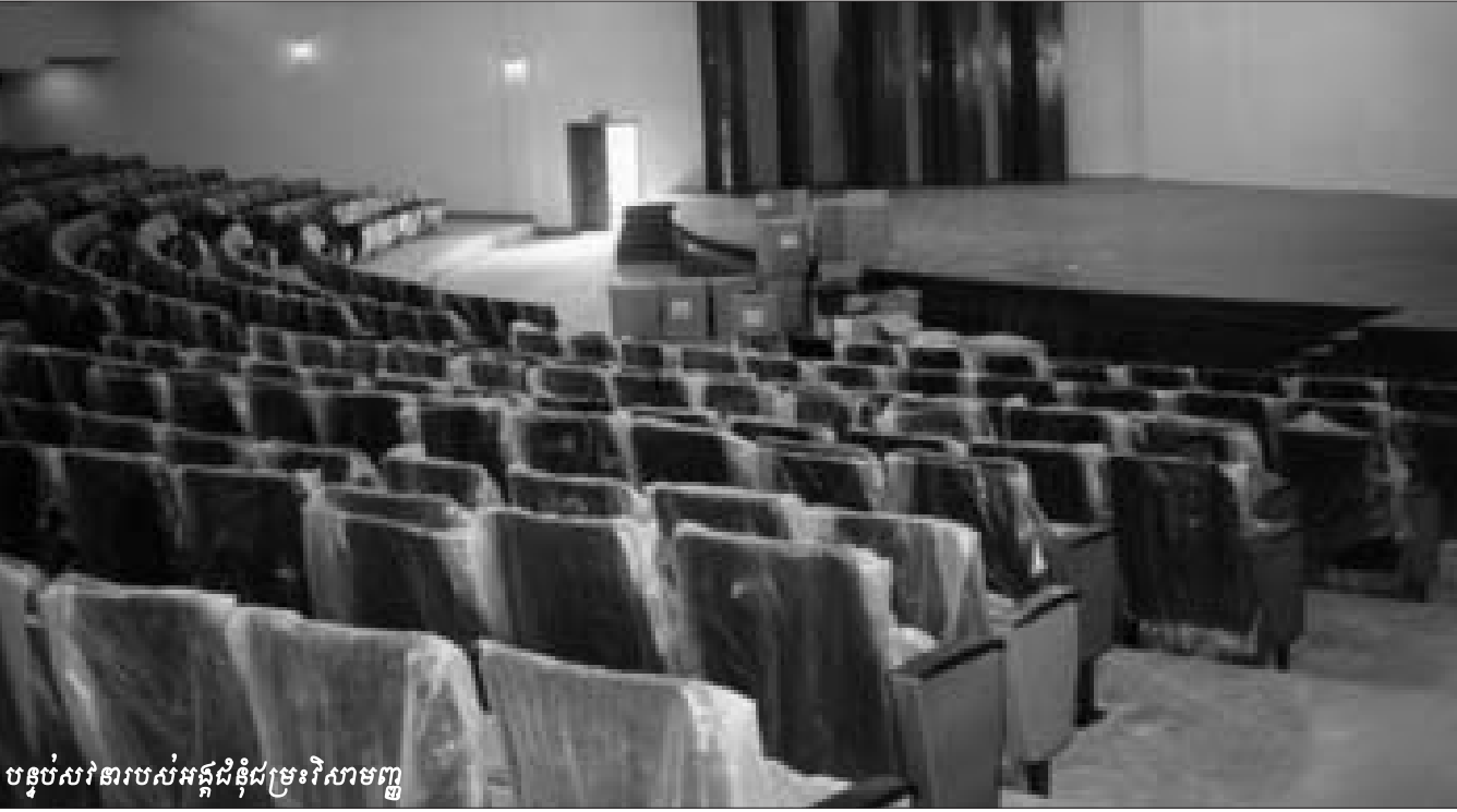
បន្ទប់សវនារបស់អង្គជំនុំជម្រះវិសាមញ្ញ

យើងខ្ញុំដឹងថាការកិច្ចនៅចំពោះមុខរបស់បុគ្គលិកនិងមន្ត្រី តុលាការទាំងអស់ ជាកិច្ចការមួយសំខាន់ ដែលចាំបាច់ត្រូវប្រើឲ្យ អស់លទ្ធភាពនូវបទពិសោធន៍ ការប្រឹងប្រែងនិងភាពអត់ធ្មត់ ប៉ុន្តែ យើងខ្ញុំសន្យាថា នឹងខិតខំឲ្យអស់ពីសមត្ថភាពដើម្បីទទួលខុសត្រូវ នូវរាល់កាតព្វកិច្ចដែលបានចាត់តាំងក្នុងន័យសបញ្ជាក់ថា ភាព យឺតយ៉ាវក្នុងការរកយុត្តិធម៌នឹងមិនមានន័យថាមិនមានយុត្តិធម៌ សម្រាប់ប្រជាជនកម្ពុជានោះទេ ។