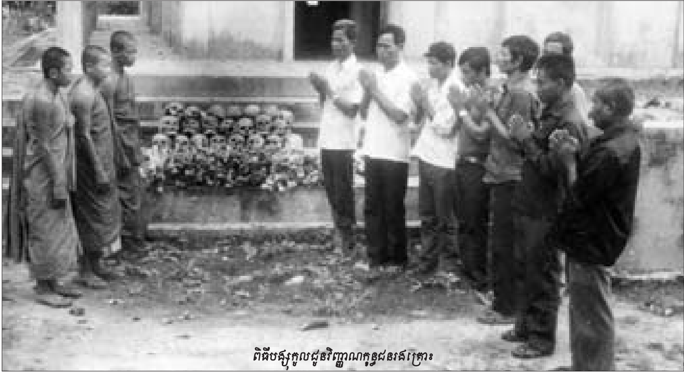
ពិធីបង្ក្រាបដួលរលំក្នុងនាមនៃគ្រោះ

ក្នុងតួនាទីជាអ្នកស្រាវជ្រាវ ខ្ញុំបានជួបសម្ភាសជាមួយ អតីតជនដែលនឹងជនរងគ្រោះនៃរបបខ្មែរក្រហមជាច្រើននាក់ ។ ខ្ញុំយល់ឃើញថា ប្រជាជនកម្ពុជាសព្វថ្ងៃមានការលំបាកក្នុងការ សម្រេចចិត្ត ថាតើត្រូវកាត់ទោសអតីតជនដែលខ្មែរក្រហម