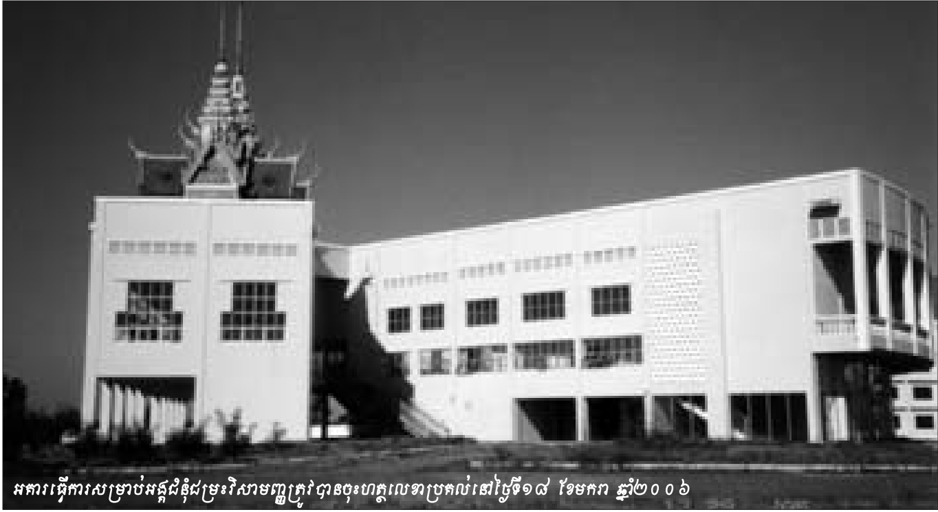
អគារធ្វើការសម្រាប់អង្គជំនុំជម្រះវិសាមញ្ញក្រៅបានចុះហត្ថលេខាប្រគល់នៅថ្ងៃទី១៨ ខែមករា ឆ្នាំ២០០៦

ជំនួសមុខឲ្យក្រុមការងារដែលមានឯកឧត្តមទទួលបន្ទុករដ្ឋមន្ត្រីសុខ អាន ជាប្រធាន យើងខ្ញុំសូមសម្រេចនូវការកោតសរសើរដល់កងយោធពលខេមរភូមិន្ទ ចំពោះការយល់ព្រមពន្យារពេលបីឆ្នាំក្នុងការប្រើប្រាស់ទីតាំងអគ្គបញ្ជាការថ្មីនេះដែលពួកគេកំពុងទន្ទឹមរង់ចាំ ។ ភាគីកម្ពុជានិងភាគីអង្គការសហប្រជាជាតិជឿជាក់ថា នេះជាទីកន្លែងដែលល្អវិសេសសម្រាប់ធ្វើជាទីតាំងរបស់អង្គជំនុំជម្រះវិសាមញ្ញក្នុងតុលាការកម្ពុជា - មានកន្លែងចាំបាច់សម្រាប់ការិយាល័យ និងបន្ទប់សវនាការស្ថិតក្នុងបរិវេណតែមួយ លើសពីនេះទៀតគឺ ប្រកបដោយសុវត្ថិភាពជាងនិងជួយកាត់បន្ថយភាពរំខានដល់ប្រជាជនក្នុងក្រុងភ្នំពេញក្នុងកំឡុងពេលនៃដំណើរការជំនុំជម្រះក្តី ។