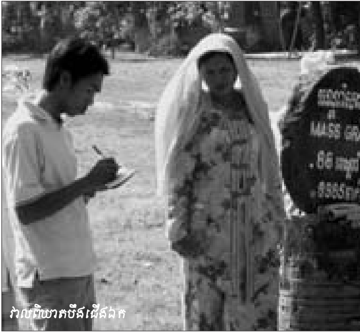
វាលពិឃាតប៊ីដដើងឯក

ប្រល័យពូជសាសន៍ ដូចជា ចេតនាបំផ្លាញទាំងស្រុងឬដោយ ផ្នែកលើរូបរាងកាយប៉ុន្តែមិនបណ្តាលឲ្យស្លាប់ និងការមិនរាប់ បញ្ចូលក្រុមនយោបាយ ។ មូលហេតុដែលអនុសញ្ញាស្តីពីអំពើ ប្រល័យពូជសាសន៍មិនអាចបំពេញភារកិច្ចរបស់ខ្លួនបានកើត ចេញពីបន្ទុកនៃកត្តាតូចៗជាច្រើន ។ កត្តាទាំងនោះគឺភាពមិនច្បាស់ លាស់ក្នុងការកំណត់និយមន័យដែលលើកឡើងខាងលើកន្លះនេះ របស់ភាគីរដ្ឋក្នុងការធ្វើអន្តរាគមន៍ និងលទ្ធផលនៃការមើលឃើញ បំណកស្រាយមិនត្រឹមត្រូវអំពីអំពើប្រល័យពូជសាសន៍ទាំងសាធា