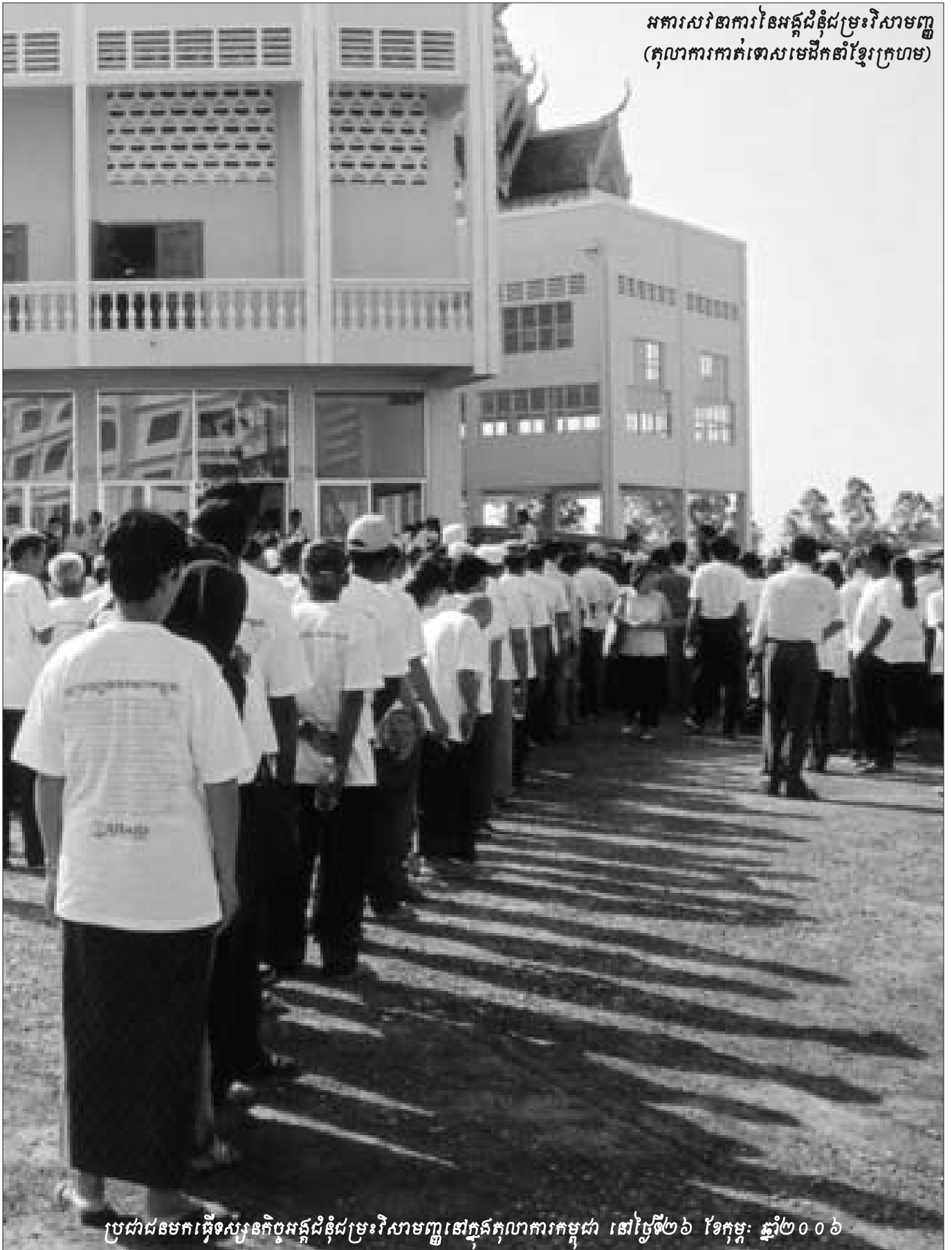
ប្រជាជនមកធ្វើទស្សនកិច្ចអង្គជំនុំជម្រះវិសាមញ្ញនៅក្នុងតុលាការកម្ពុជា នៅថ្ងៃទី២៦ ខែកុម្ភៈ ឆ្នាំ២០០៦