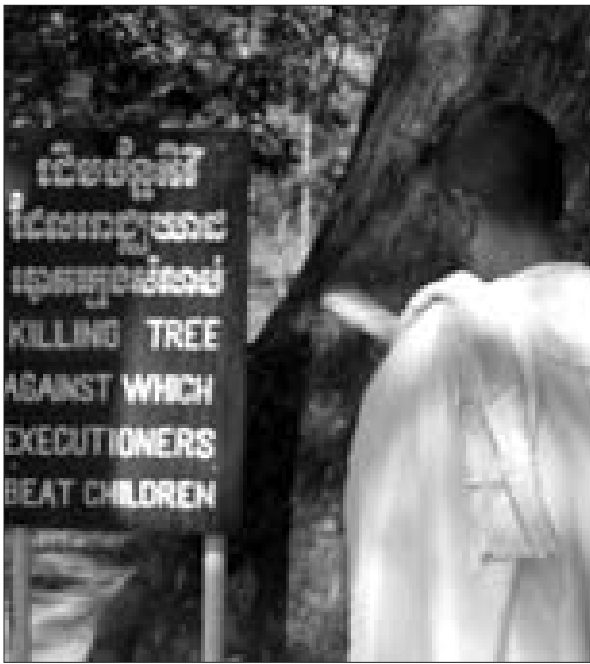
នៅវាលពិឃាតបឹងជើងឯក