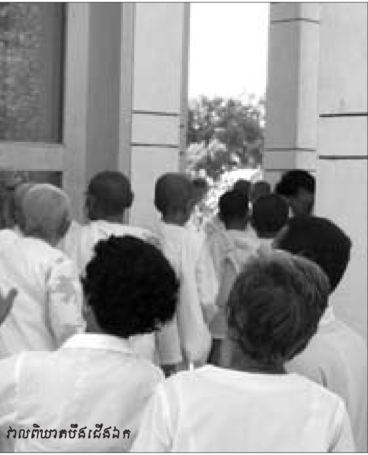
វាលពិយាតប៊ីដើងឯក

គោលការណ៍ជាមូលដ្ឋាននៃនិយមន័យនេះគឺ ការបំផ្លិច បំផ្លាញមិនរើសមុខនិងជាប្រព័ន្ធ លើសមាជិកនៃក្រុមមួយ ដោយ សារអ្នកទាំងនោះជាសមាជិកនៃក្រុមនេះ ។ អំពើប្រល័យពូជ សាសន៍បែបនេះលំដាប់ថ្នាក់ ។ វាអាចកើតឡើងក្នុងទម្រង់ជាអំពើ ប្រល័យពូជសាសន៍ទ្រង់ទ្រាយតូច ដែលមានតែជននៃក្រុមមួយ ចំនួនតូចត្រូវសម្លាប់រង្គាល់ក្នុងរយៈពេលដ៏ខ្លីមួយ ឬក៏កើតឡើង ក្នុងទម្រង់ជាអំពើប្រល័យពូជសាសន៍ទ្រង់ទ្រាយធំ ដែលមានជន នៃក្រុមមួយចំនួនធំត្រូវសម្លាប់ក្នុងរយៈពេលវែង ។ អំពើប្រល័យ ពូជសាសន៍ទ្រង់ទ្រាយធំរួមមានការសម្លាប់ជនជាតិអារមេនី ការសម្លាប់រង្គាល់ជនជាតិជីហ្គ វាលពិយាដនៅកម្ពុជា និងការកាប់ សម្លាប់ដោយកាំបិតដែលជនជាតិទុកស៊ីប្រព្រឹត្តមកលើជនជាតិ ហ្វីលីពីននៅក្នុងប្រទេសរ៉ូដេវ៉ា ។ ទោះបីយ៉ាងណាក៏ដោយ ចំនួនជន នៃក្រុមមិនអាចកំណត់ទំហំនៃអំពើប្រល័យពូជសាសន៍មួយថា សាហាវតិចឬខ្លាំងជាងអំពើប្រល័យពូជសាសន៍មួយទៀតឡើយ ។ ការចាត់លំដាប់អំពើប្រល័យពូជសាសន៍ក្រោមឈ្មោះតែមួយអាច ដោះស្រាយបញ្ហាដែល ប៊ូអ៊ី ប្រឈមមុខក្នុងការផ្តាច់ហ្សឺណូស ចេញពីអំពើប្រល័យពូជសាសន៍ ។