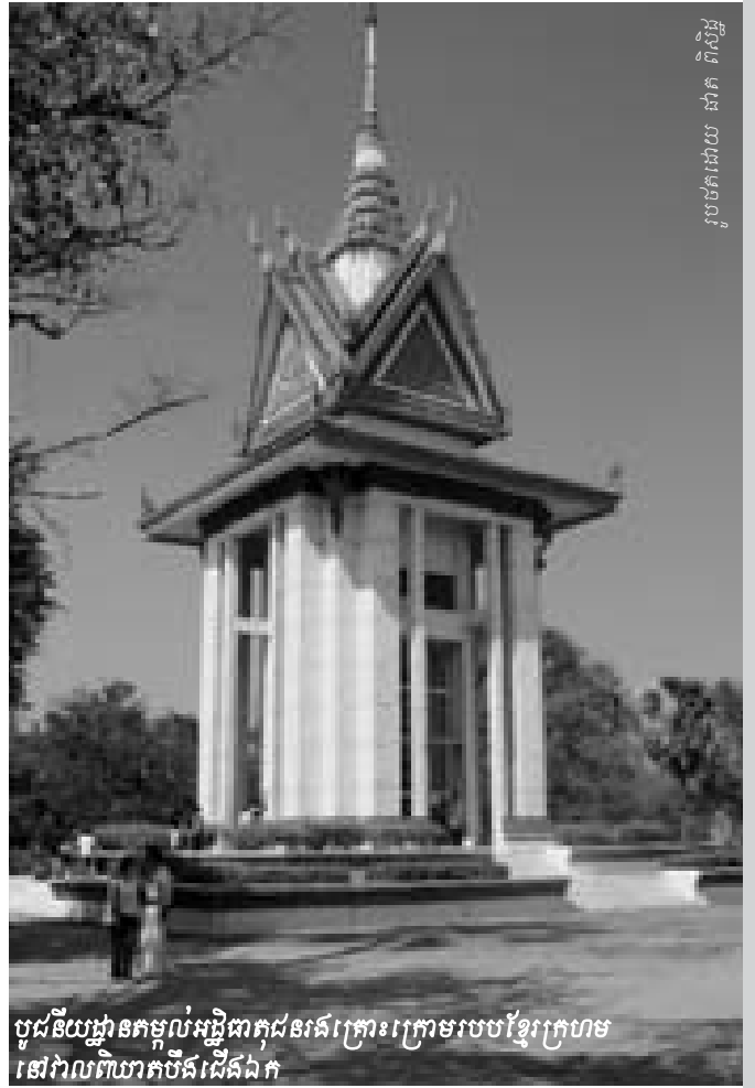
បូជនីយដ្ឋានកម្ពុជាអង្គការក្រៅរដ្ឋាភិបាលនៅភ្នំពេញ