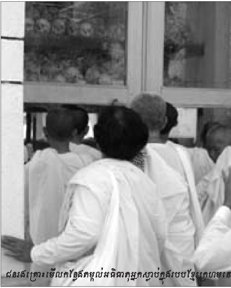
ជនរងគ្រោះមើលកន្លែងតម្កល់អធិបតីអ្នកស្លាប់ក្នុងរូបបង្កើតឡើងដោយអង្គការសហប្រជាជាតិ

បើពួកឡើងវិញ ចន្លោះឆ្នាំ១៩១៥ដល់ឆ្នាំ១៩១៨ ជន ជាតិអារមេនីជាង១លាននាក់ រាប់បញ្ចូលទាំងស្រ្តីនិងកុមារ ត្រូវ