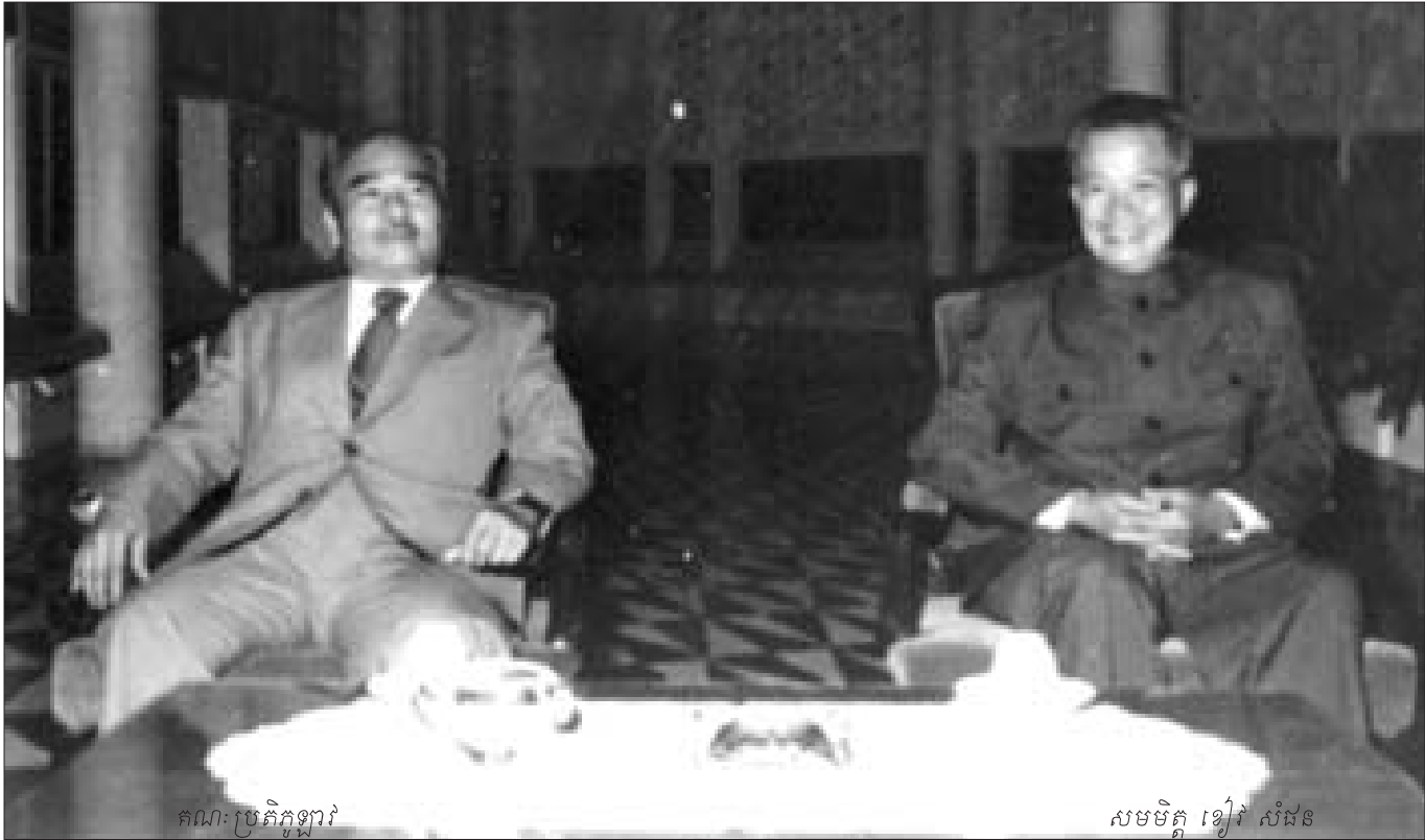
គណៈប្រតិភូឡាវ

ក្រៅពីការងារបកប្រែ ខ្ញុំប្រជុំជាមួយអភិបាលក្រុងប៉ៃលិន ហ៊ុន ទេន លោក ម៉ា ឡៅពី លោក ស៊ីម ដីម៉េង និងនាយទាហាននាយទាហានរង ពលទាហាន គ្រួសារយុទ្ធជន ដើម្បីសរសេរសំណើសុំឱ្យទុក្ខមស្នងការជនភៀសខ្លួនមេត្តាជួយសុំសិទ្ធិជ្រកកោននៅប្រទេសទីបី។ ៦ ខែក្រោយមក អ្នកនៅក្នុងជំរំទាហានរបស់យើងត្រូវបានអនុញ្ញាតឱ្យចេញទៅប្រទេសទី៣មុន ៦ ជំរំជនភៀសខ្លួនស៊ីវិលចេញទៅក្រោយជាដំណាក់កាលៗ។ មុនថ្ងៃចេញដំណើរទៅប្រទេសទី៣ ខ្ញុំដេកមិនលក់អន្ទះអន្ទែនរិលរវល់ក្នុងចិត្ត ណាមួយព្រាត់ទឹកមួយបងប្អូនញាតិសន្តានពុំបានទៅជាមួយ។ ទីបំផុត ខ្ញុំជម្រាបលោកអភិបាលក្រុងប៉ៃលិនថា “ខ្ញុំបាទសម្រេចមិនទៅប្រទេសទី៣ទេ មូលហេតុនឹកទឹកមួយបងប្អូន ប្រសិនបើខ្ញុំនៅប្រទេសថៃឬឡាវ ថ្ងៃណាមួយប្រទេសជាតិមានសន្តិភាពពេញបរិបូណ៌នឹងអាចរិលចូលក្នុងស្រុកខ្មែរវិញ”។ ថ្ងៃទី២៨ ខែវិច្ឆិកា ឆ្នាំ១៩៧៥ ខ្ញុំចាកចេញពីជំរំថៃធ្វើ