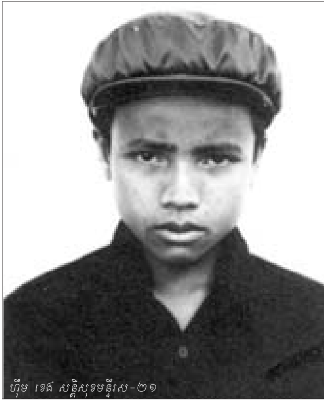
ហ្វឹម ខេង សន្តិសុខមន្ទីរស-២១

មន្ទីរសន្តិសុខនៅក្នុងរបបកម្ពុជាប្រជាធិបតេយ្យមាន៥ ថ្នាក់ : មន្ទីរឈ្មួញឃុំ មន្ទីរអប់រំស្រុក មន្ទីរសន្តិសុខតំបន់ មន្ទីរសន្តិសុខ ភូមិភាគ និងមន្ទីរសន្តិសុខមជ្ឈិម ហៅ មន្ទីរស-២១ ។