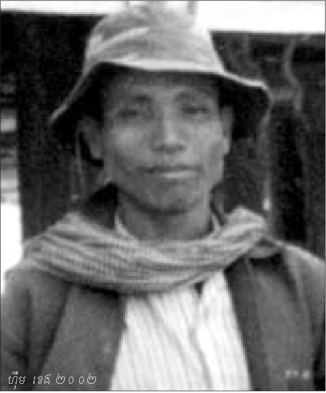
ហ៊ឹម ខេង ២០០២

ខ្នាំងខាងក្នុងជាប្រភេទខ្នាំងដែលបក្សកុម្មុយនិស្តកម្ពុជា ខ្វល់ខ្វាយជាខ្នាំង ហើយខ្នាំងប្រភេទនេះមានចំនួនរហូតដល់រាប់ សែននាក់ ។ ខ្នាំងទាំងនោះរស់នៅនិងធ្វើការនៅក្នុងសហករណ៍ ស្រុក តំបន់ និងក្រុមភាគ ជាមួយនឹងប្រជាជនកម្ពុជា ទាំងប្រជា ជនថ្មី (១៧មេសា) និងប្រជាជនមូលដ្ឋាន ។ សៀវភៅទង់ ក្រហមភិក្តិយសបានបញ្ជាក់ថា “ខ្នាំងខាងក្នុងភាគច្រើនស្ថិតនៅ ក្នុងវណ្ណៈអនុធន វណ្ណៈកសិករខ្លះ តែជាកសិករដែលអស់ធាតុ