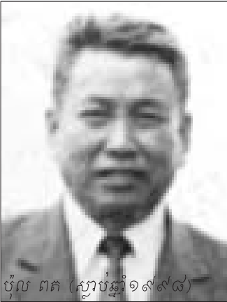
ប៉ុល ពត (ស្លាប់ឆ្នាំ១៩៧៨)

ជ.ក្រុមប្រឹក្សាជាតិរណសិរ្សសាមគ្គីកសិករពារមាតុភូមិកម្ពុជា ប្រធាន ជា ស៊ឹម