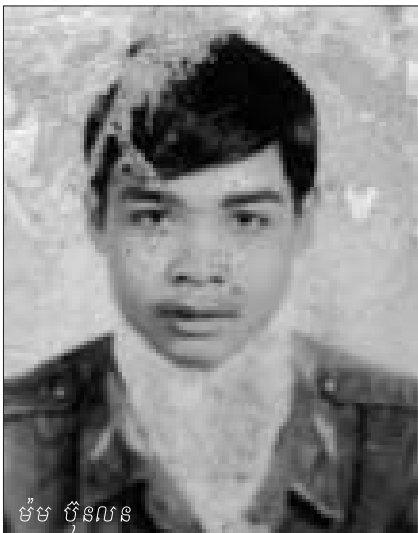
ម៉ម ប៊ុនលន

សុទ្ធតែប្រជាជនដែលអង្គការជម្រុញស្ត្រីឃុំការកោងទៅ លើកលែងតែកម្មាភិបាលដែលគ្រប់គ្រងយើងដែលជាអ្នកមូលដ្ឋាន ។ យើងត្រូវអង្គការចាត់តាំងឲ្យផ្លាស់ប្តូរទីកន្លែងរស់នៅច្រើនកន្លែង ។ យើងផ្លាស់ទៅនៅភូមិ