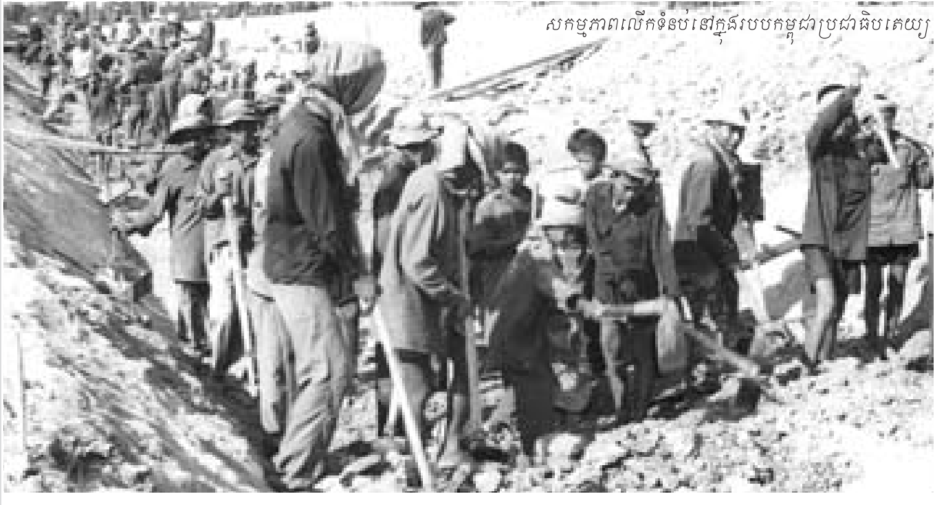
សកម្មភាពលើកទំនប់នៅក្នុងរបបកម្ពុជាប្រជាធិបតេយ្យ