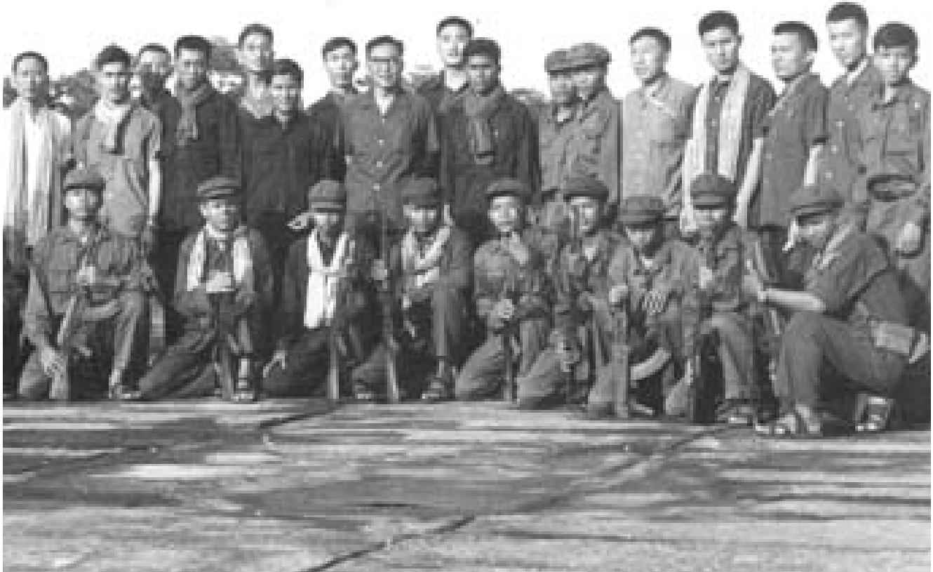
ជំនាញការចិននិងយុទ្ធជនខ្មែរក្រហម