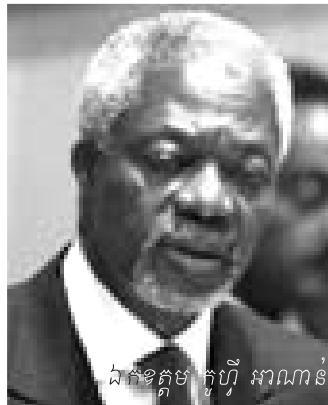
ឯកឧត្តម កូហ្វី អាណាន់

អគ្គលេខាធិការអង្គការសហប្រជាជាតិបានចាត់វិធានការដើម្បីការពារមិនឲ្យមានអំពើប្រល័យពូជសាសន៍តាមរយៈប្រព័ន្ធអង្គការសហប្រជាជាតិនៅក្នុងសុន្ទរកថាទៅកាន់គណៈកម្មការសិទ្ធិមនុស្ស។ សុន្ទរកថានេះត្រូវបានធ្វើឡើងក្រោយពេលដែលអង្គប្រជុំទាំងមូលបានគោរពវិញ្ញាណកម្មជនរងគ្រោះនៃអំពើប្រល័យពូជសាសន៍នៅប្រទេសរ៉ូងដាដោយស្ងៀមស្ងាត់រយៈពេលពីរនាទី។