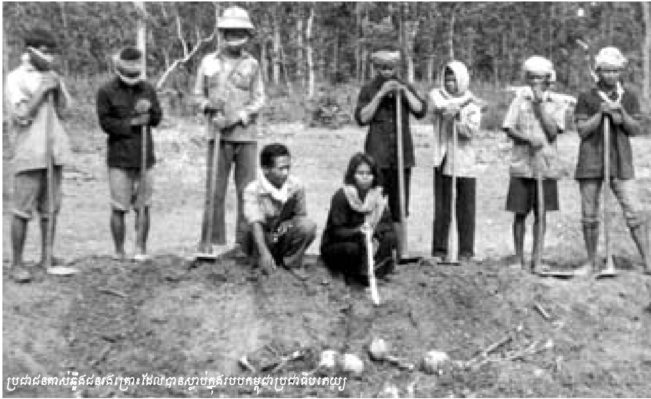
ប្រជាជនកាន់ស្លឹកដំណើរការដែលបានស្លាប់ក្នុងរបបកម្ពុជាប្រជាធិបតេយ្យ