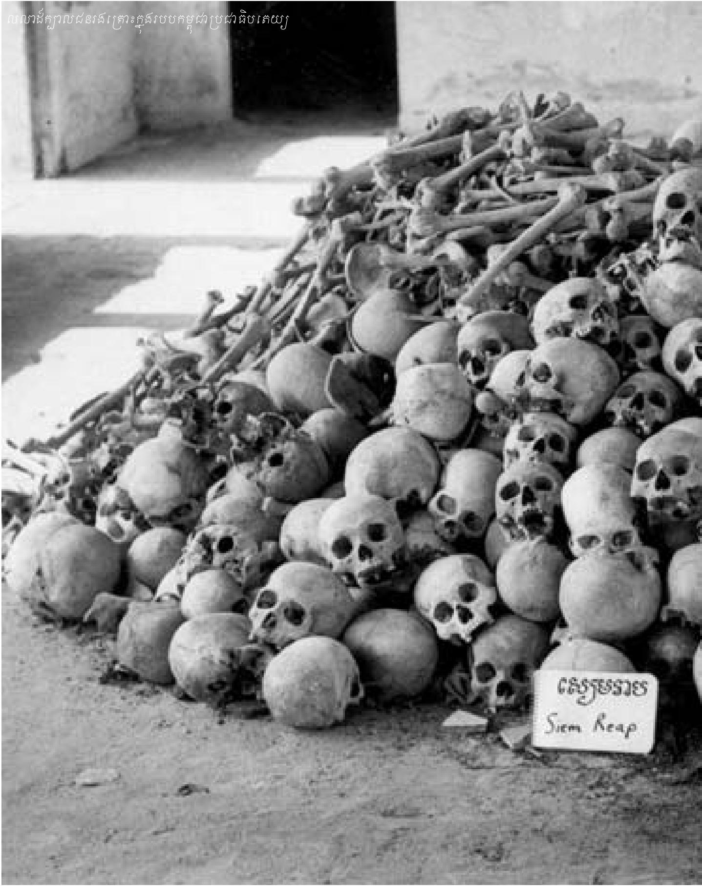
លំហូរជំនួញដីស្រែក្រោយក្នុងរបបកម្ពុជាប្រជាធិបតេយ្យ