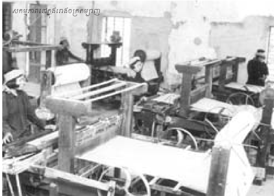
សកម្មភាពនៅក្នុងរោងចក្រតម្បាញ

៧) ការប្រើប្រាស់ដីដើម្បីបង្កើនផល ត្រូវគិតគូរ ទិសដៅយ៉ាងតិច៖ ទី១ ដីដែលមានហើយពិសេសដីល្អត្រូវប្រើ ប្រាស់វាឲ្យបានជាអតិបរមាដំបូងមិញ ហើយត្រូវលើក កុណភាពដីនេះឲ្យជាប់ដោយបញ្ហាទឹក បញ្ហាដី បញ្ហាដាំតាម របៀបវិទ្យាសាស្ត្រ ក៏ដំអស់ដីតិចប៉ុន្តែបានផលច្រើន ។ ទី២ ទន្ទឹមនឹងនេះក៏ត្រូវពង្រីកដីថ្មីដែលល្អថែមទៀតឲ្យកាន់តែច្រើន ឡើង កុំពង្រីកដីមិញ ។