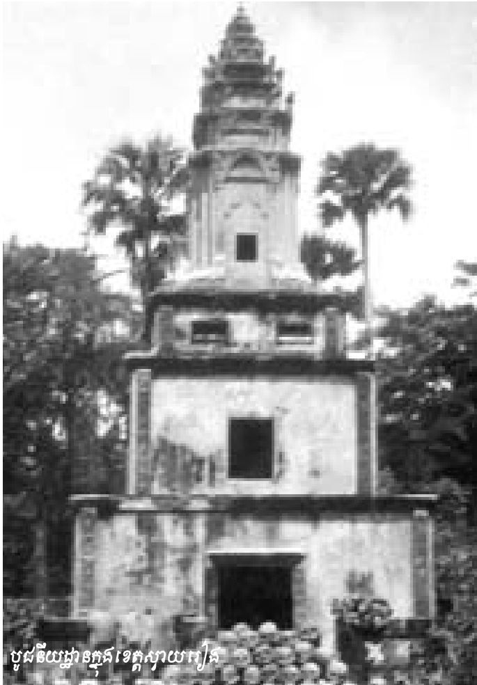
បូជនីយដ្ឋានក្នុងខេត្តស្វាយរៀង