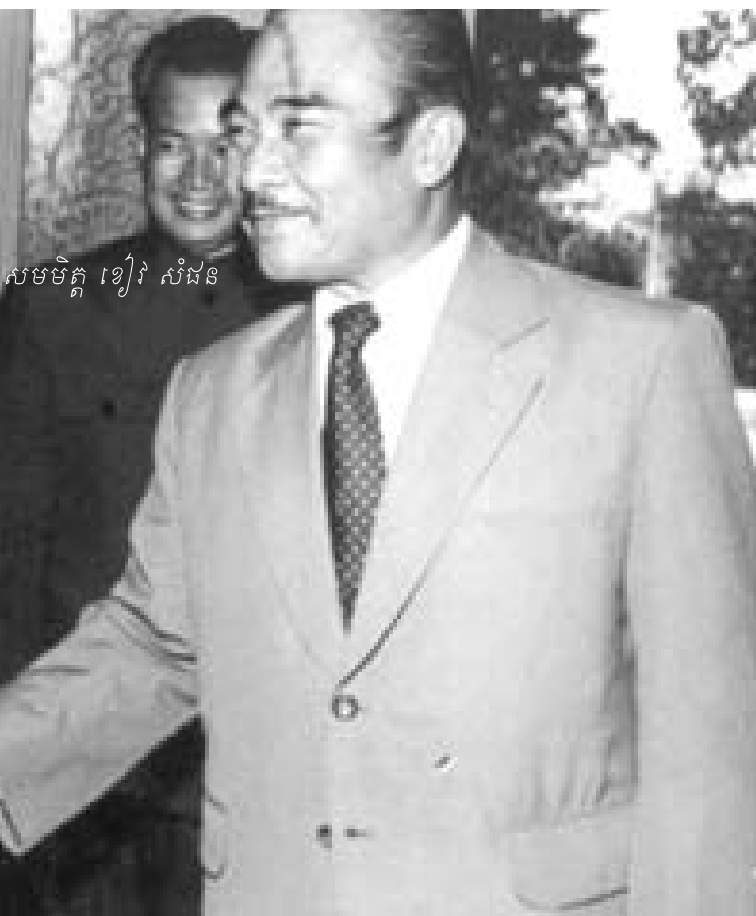
សមមិត្ត ខៀវ សំផន

ខ្មែរក្រហមក៏គំណាត់ឲ្យនិន្នាការមួយដែលចង់បានយុត្តិធម៌ សង្គម ប្រឆាំងអំពើពុករលួយ និងអំពើដែលអ្នកមានឆ្លៀតកេង ប្រវ័ញ្ចលើទុក្ខវេទនារបស់អ្នកក្រខ្សត់ ។