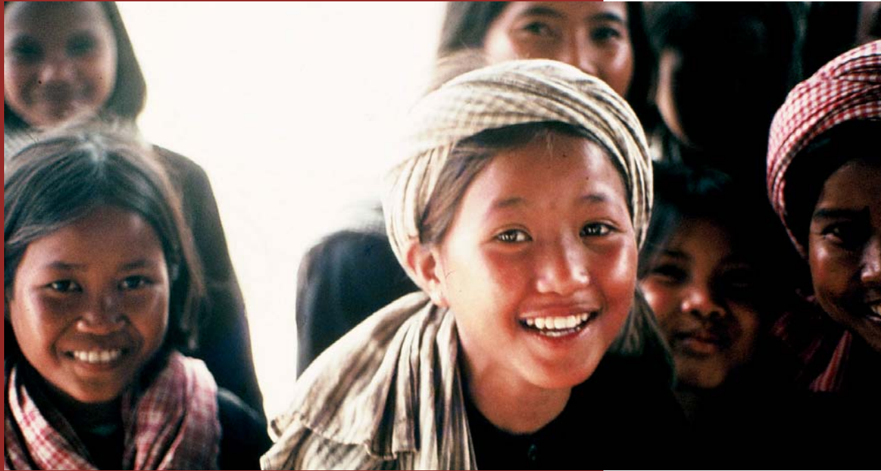
ពីលើចុះក្រោម ពីឆ្វេងទៅស្តាំ : អភិកស្ថានីយ៍វេយ្យុក្រុងនៅខេត្តកំពង់ចាម, ក្រុមគ្រួសារមកពីទីក្រុង, កុមារនិងក្រុមស្រៀននៅសហករណ៍, កុមារនៅសហករណ៍