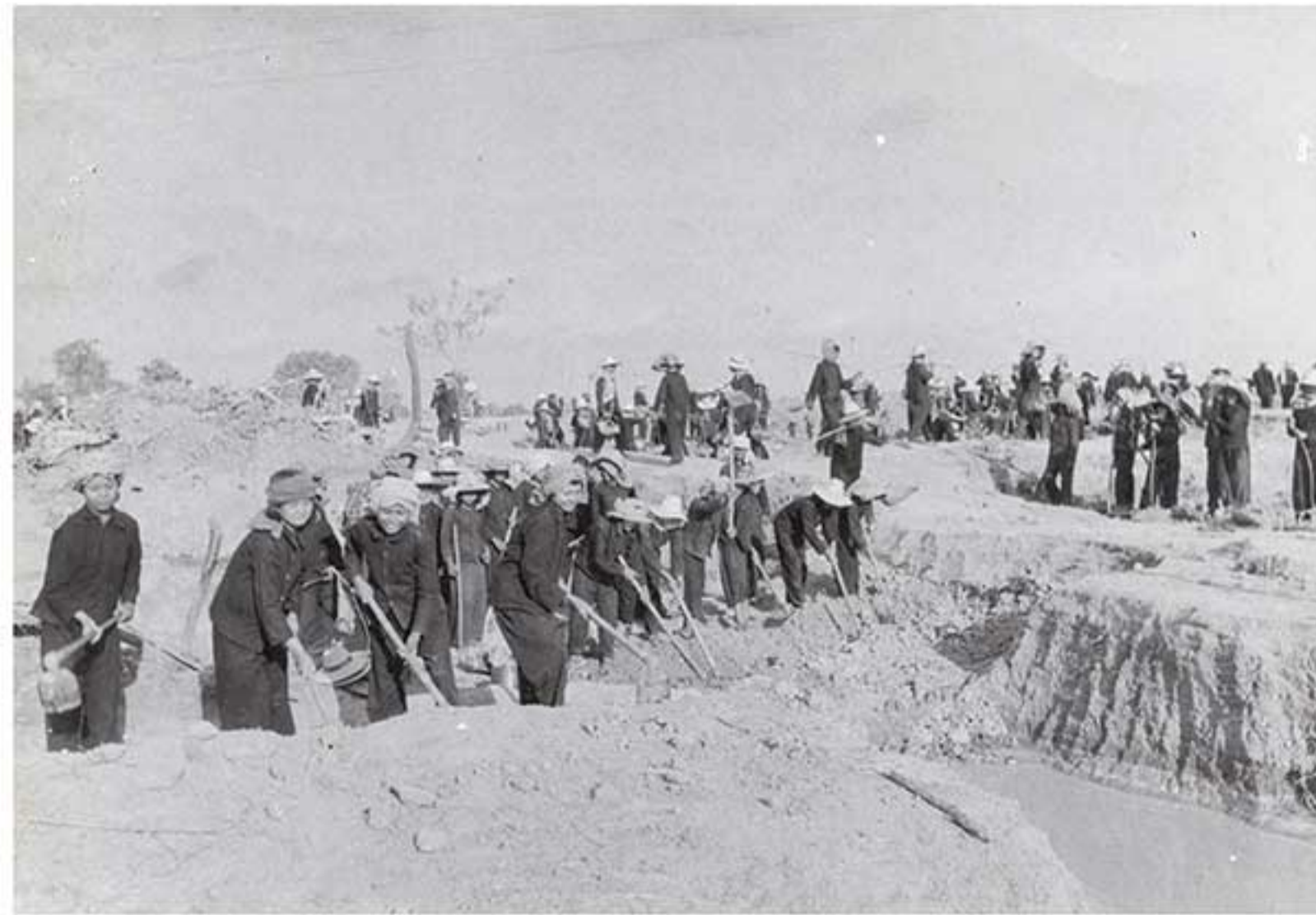
កងកម្លាំងបុរសនិងនារីកំពុងដឹកដីក្នុងប្រទេសខ្មែរក្រហម។ (ប្រថងនេះបានថតនៅពេលដែលកម្មាភិបាលជាន់ខ្ពស់ខ្មែរក្រហម ឬក្រុមជនជាតិបរទេស និងមន្ត្រីទស្សនាខ្មែរក្រហមមកធ្វើដំណើរទស្សនាទៅកាន់តំបន់នេះ។ គ្រប់ពេលដែលមានដំណើរទស្សនា ប្រជាជនគ្រប់ប្រភេទត្រូវតែងទទួលបានស្ថាពរ និងនៅពេលខ្លះខ្មែរក្រហមបានផ្តល់សំលៀកបំពាក់ និងក្រមាជាបណ្តោះអាសន្នដល់ពួកគេ។ នៅពេលកម្មាភិបាលខ្មែរក្រហមធ្វើដំណើរមកកាន់តំបន់ ប្រជាជនគ្រប់ប្រភេទត្រូវបានបង្គាប់ឱ្យញញឹមដាក់ម៉ាស៊ីនថតនិងសំរាប់ស្តារមន្ត្រីដំណើររបស់កម្មាភិបាល ខ្មែរក្រហម។