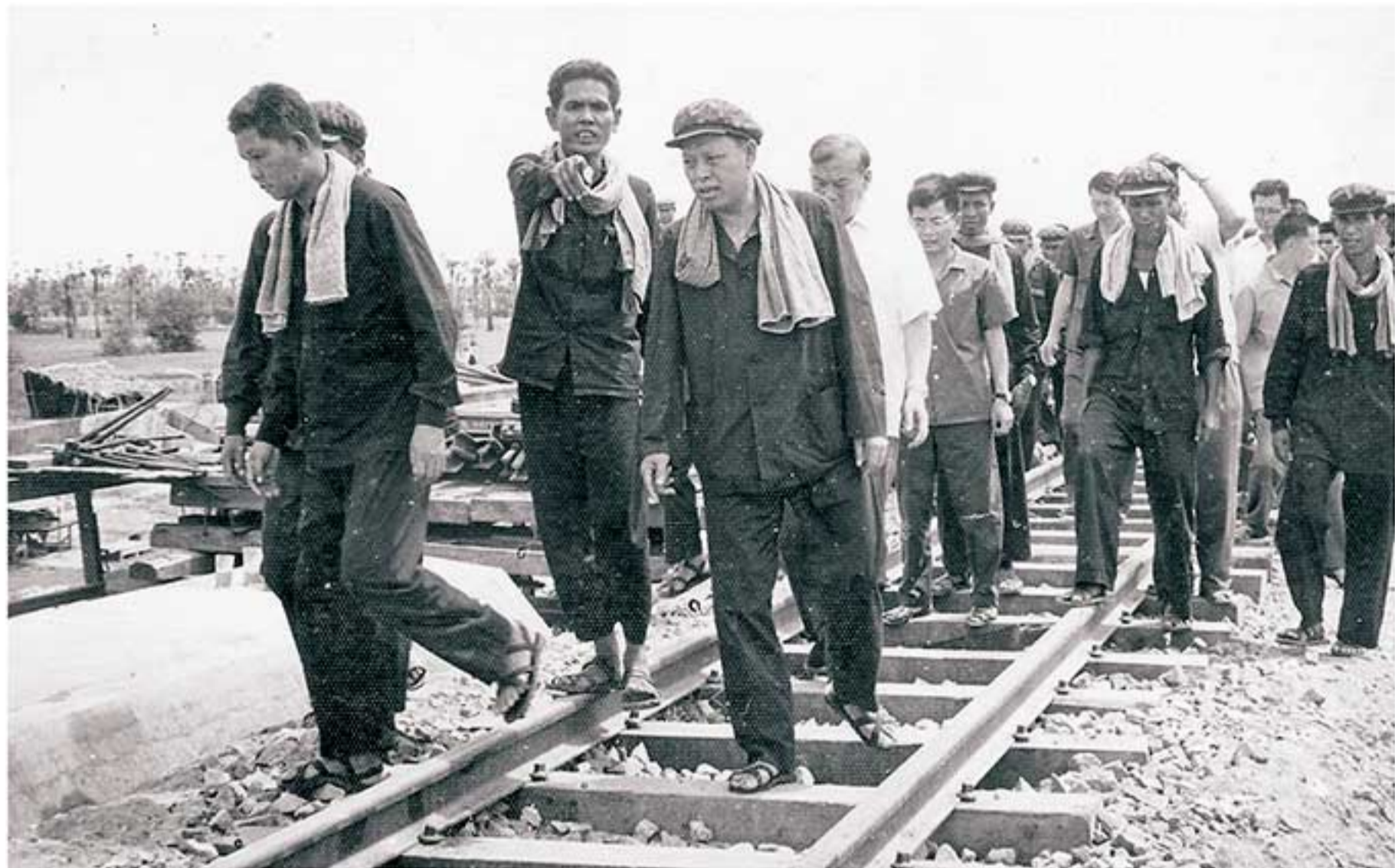
អៀង សារី ជាមួយនឹងគណៈប្រតិភូចិន ចុះត្រួតពិនិត្យការដ្ឋានថ្មីដែលកំពុងសាងសង់នៅក្នុងអំឡុងពេលផ្លាស់ប្តូរមនុស្សជាតិ ដោយបង្ខំនៅចុងឆ្នាំ១៩៧៥។ Ieng Sary with a Chinese delegation inspecting the railway during the forced transfer of people in late 1975.