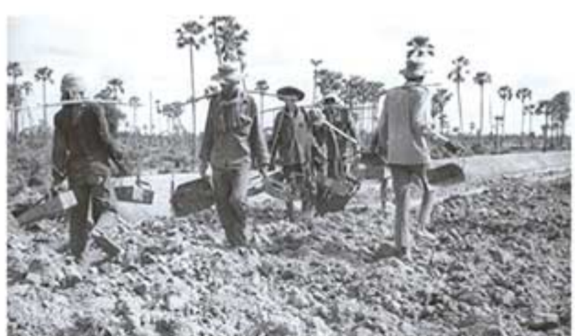
សកម្មភាពជញ្ជូនដីនៅក្នុងគម្រោងលើកទំនប់ដឹកប្រឡាយ Transporting dirt on an irrigation project