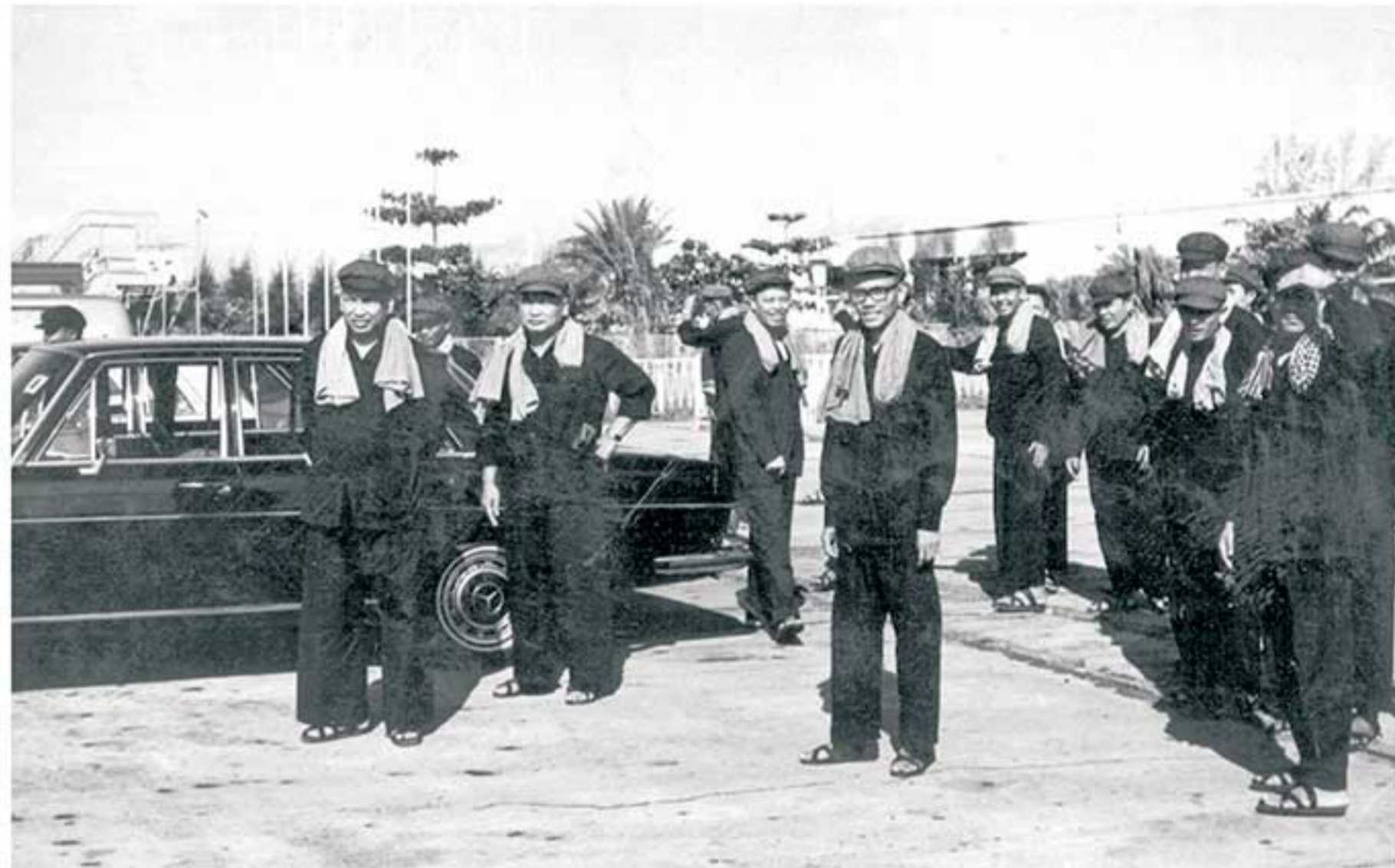
មេដឹកនាំកម្ពុជាប្រជាធិបតេយ្យ និងជាសមាជិកគណៈអចិន្ត្រៃយ៍នៃគណៈកម្មាធិការមជ្ឈិមបក្សកុម្មុយនីស្ត កម្ពុជា (ពីឆ្វេងទៅស្តាំរួមមាន៖ ប៉ុល ពត (លេខាធិការកុម្មុយនីស្តកម្ពុជា និងជានាយករដ្ឋមន្ត្រី នៃកម្ពុជាប្រជាធិបតេយ្យ), នួន ជា (អនុលេខាធិការកុម្មុយនីស្តកម្ពុជានិងជាប្រធានសភាគណៈប្រជាជនកម្ពុជា), អៀង សារី (ឧបនាយករដ្ឋមន្ត្រីទទួលបន្ទុកកិច្ចការបរទេស), សុន សេន (ឧបនាយករដ្ឋមន្ត្រីទទួលបន្ទុកការពារជាតិ), វន វ៉ែត (ឧបនាយករដ្ឋមន្ត្រីទទួលបន្ទុកផ្នែកសេដ្ឋកិច្ច) DK leaders and members of the Standing Committee of the Central Committee of the Communist Party of Kampuchea (CPK). Facing forward from the left, Pol Pot (CPK Secretary and Prime Minister of Democratic Kampuchea (DK)), Nuon Chea (Deputy Secretary of the CPK and DK President of the People's Representative Assembly), Ieng Sary (Deputy Prime Minister for Foreign Affairs), Son Sen (Deputy Prime Minister for Defense), and Vorn Vet (Deputy Prime Minister for Economy).