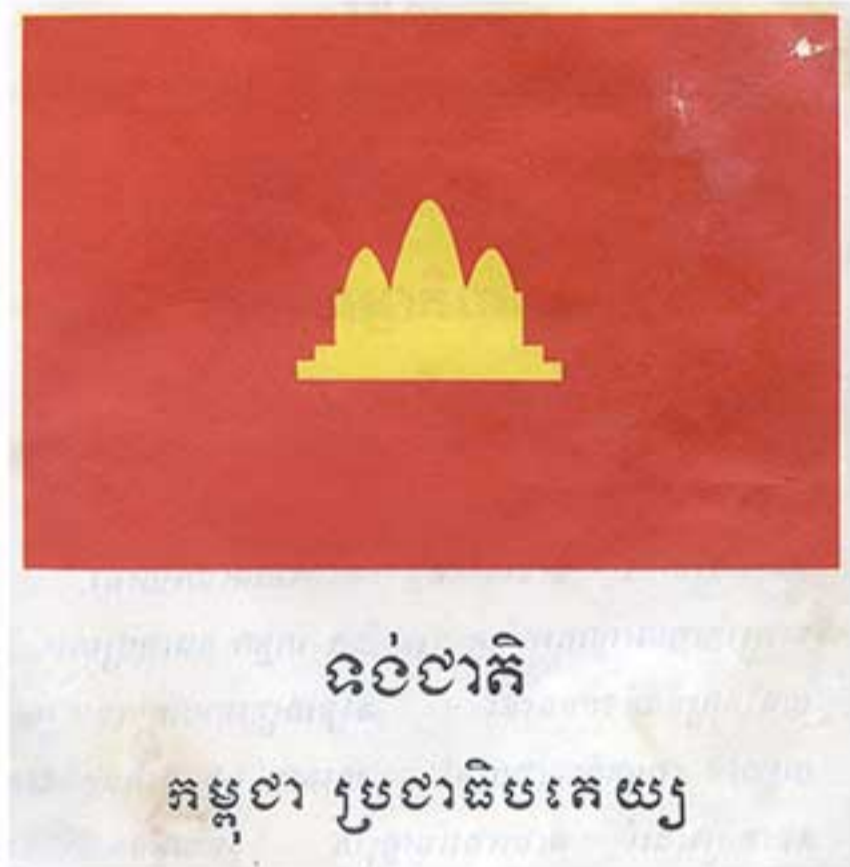
ទង់ជាតិកម្ពុជាប្រជាធិបតេយ្យ Democratic Kampuchea's flag