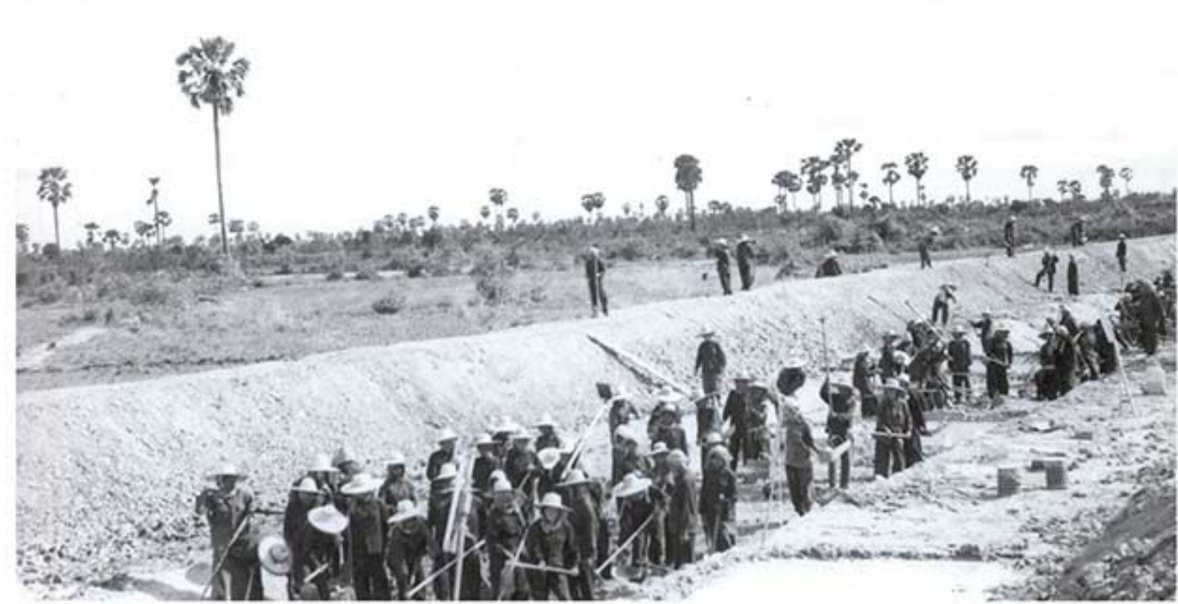
ប្រជាជនកម្ពុជាកំពុងដឹកប្រឡាយទឹកនៅជិតក្រុងភ្នំពេញក្នុងប្រទេសខ្មែរក្រហម។ ប្រជាជនគ្រប់ប្រភេទត្រូវតែងទទួលបានស្ថាពរ និងនៅពេលខ្លះខ្មែរក្រហមបានផ្តល់សំលៀកបំពាក់ និងក្រមាជាបណ្តោះអាសន្នដល់ពួកគេ។ នៅពេលកម្មាភិបាលខ្មែរក្រហមធ្វើដំណើរមកកាន់តំបន់ ប្រជាជនគ្រប់ប្រភេទត្រូវបានបង្គាប់ឱ្យញញឹមដាក់ម៉ាស៊ីនថតនិងសំរាប់ស្តារមន្ត្រីដំណើររបស់កម្មាភិបាល ខ្មែរក្រហម។ Cambodian people digging the dam in the suburb of Phnom Penh during the Khmer Rouge regime. All people were obliged to work during the regime. The Khmer Rouge regime compelled large portions of the population to conduct manual labor on a daily basis in order to increase the country's production of rice.