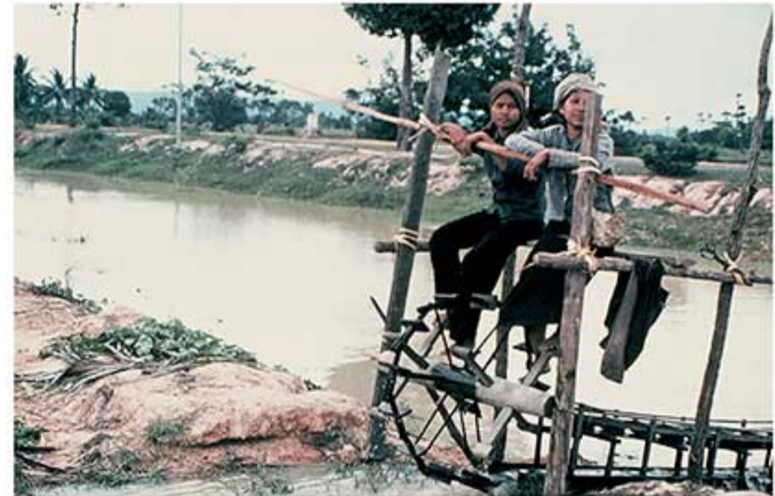
កសិករកំពុងប្រមូលទឹកនៅវាលស្រែ Irrigation workers in the fields