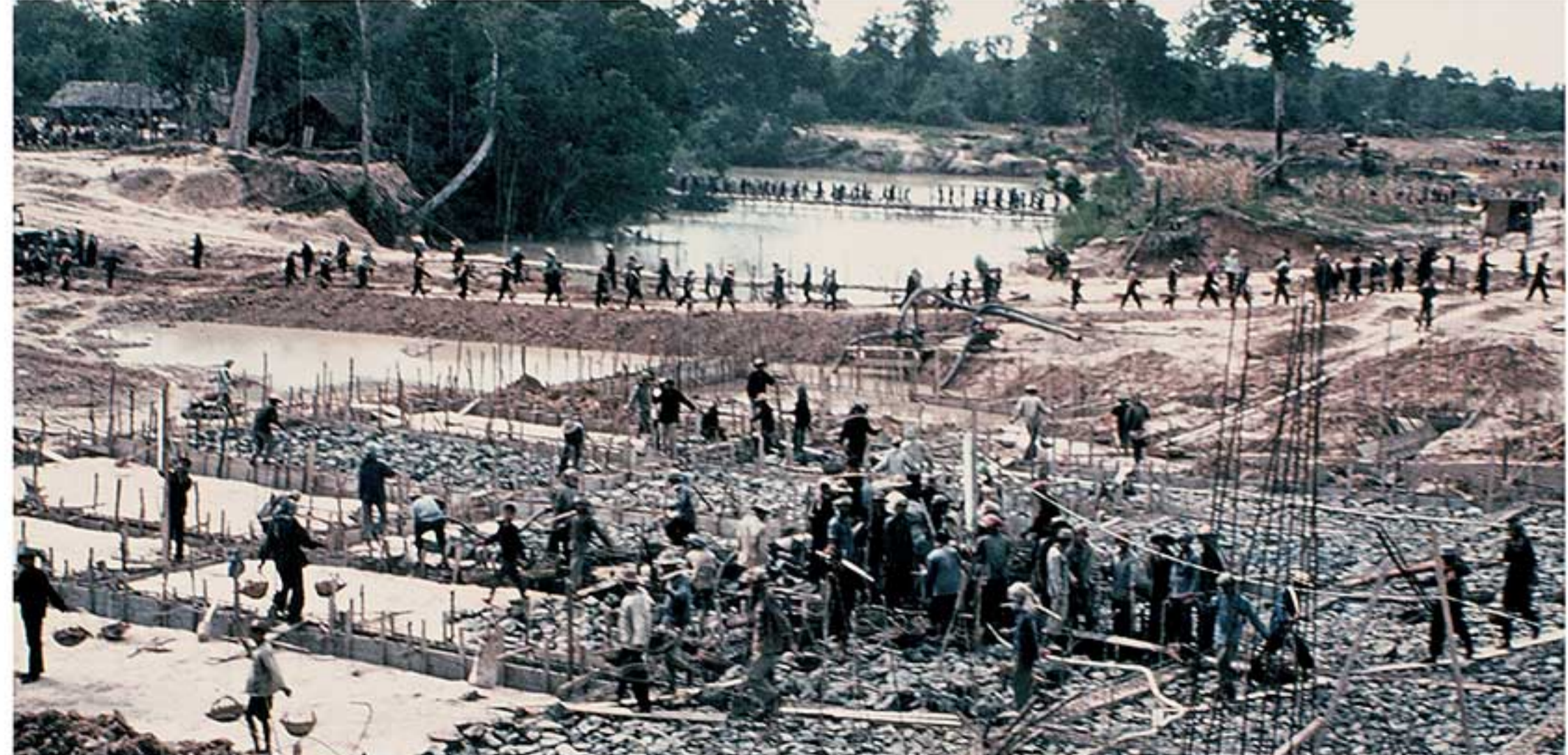
ប្រជាជនកំពុងលើកទំនប់ទឹក និងដឹកប្រឡាយទឹក។ Irrigation dam construction on the road north