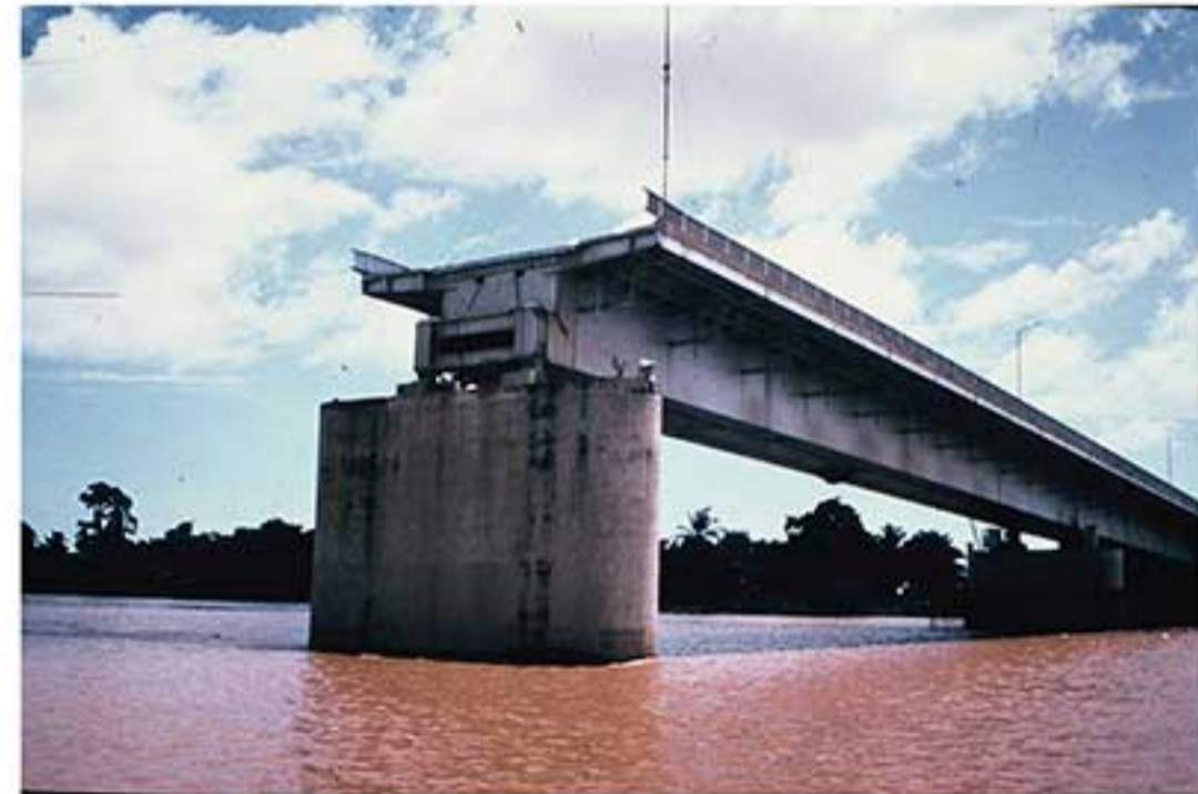
ស្ពានប្រោយចង្វារ នៅទីក្រុងភ្នំពេញ ដែលត្រូវបានបំផ្លាញដោយសារគ្រាប់បែក។ Bombed or blown up bridge (Chrouy Chang Var Bridge) over the Mekong (Phnom Penh)