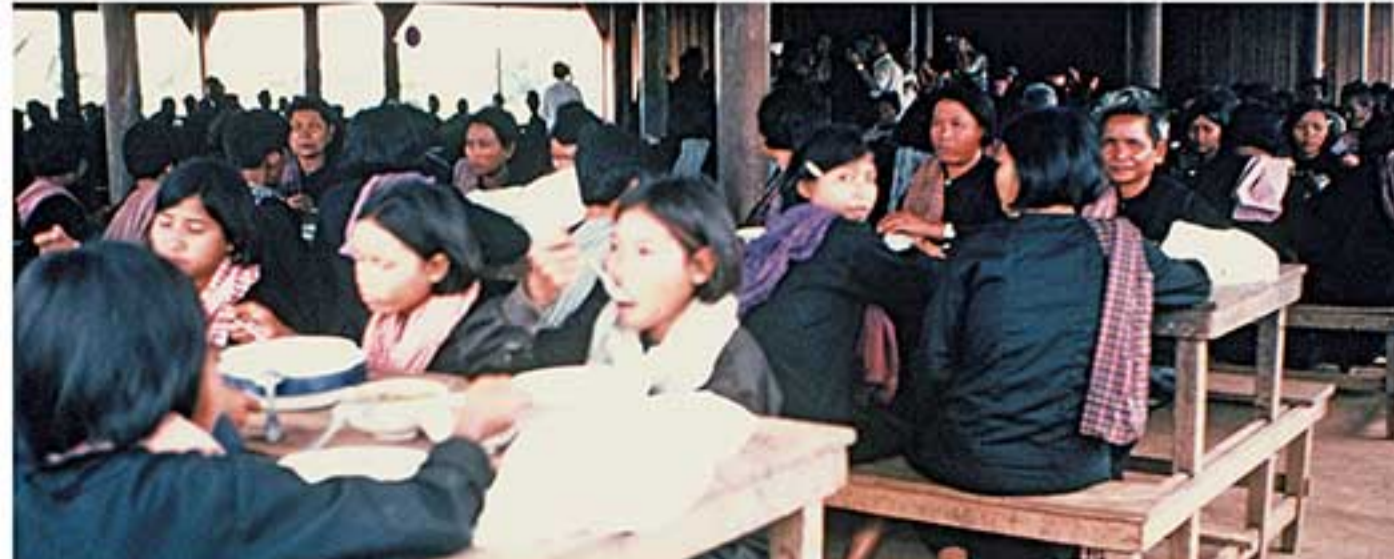
ការប្រមូលទឹកនៅសហគមន៍ Communal eating at the cooperative