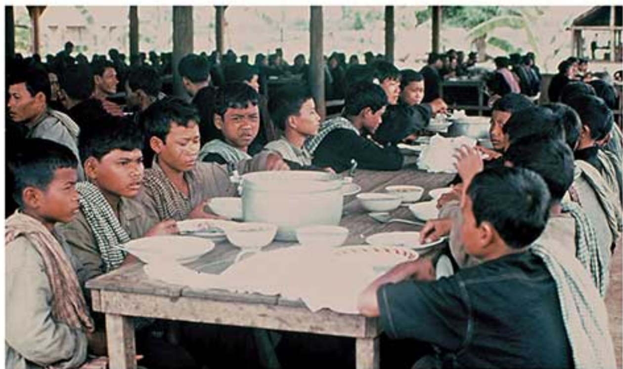
ការហូបចុករួម Communal eating