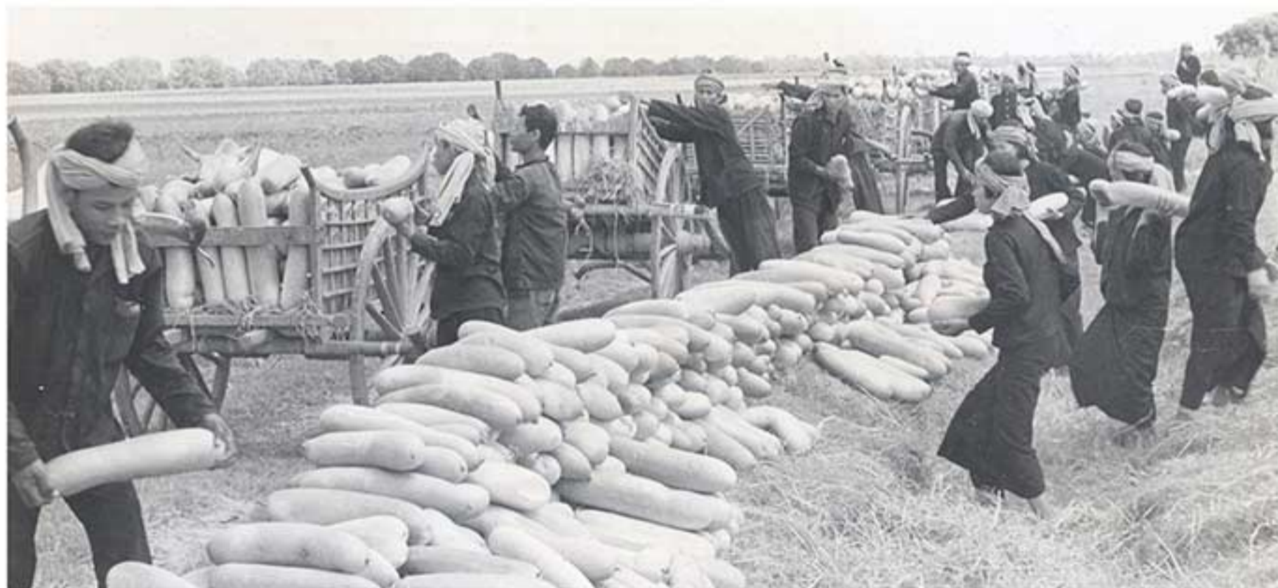
កងបង្គុំបង្កើនផលកំពុងប្រមូលផលក្រឡាច។ Agricultural unit collect wax gourd.