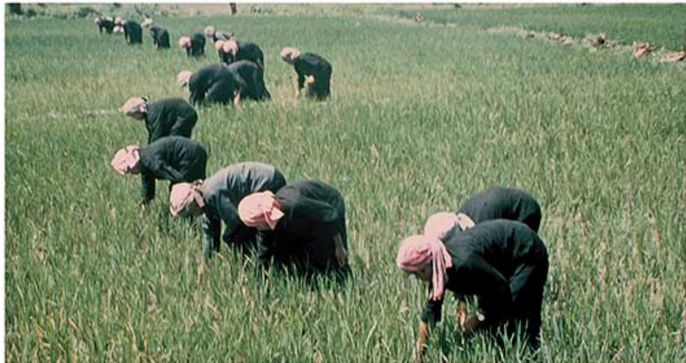
សហករណ៍កងកម្លាំងនារីកំពុងធ្វើការនៅវាលស្រែ Female workers from a cooperative work in a rice field