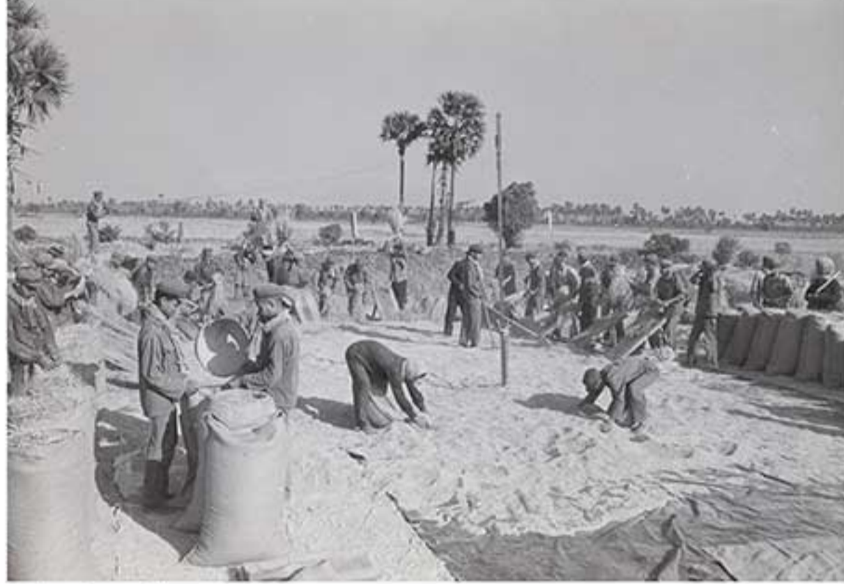
កម្មាភិបាលខ្មែរក្រហមធ្វើការប្រមូលផលស្រូវ The Khmer Rouge cadre harvesting rice.