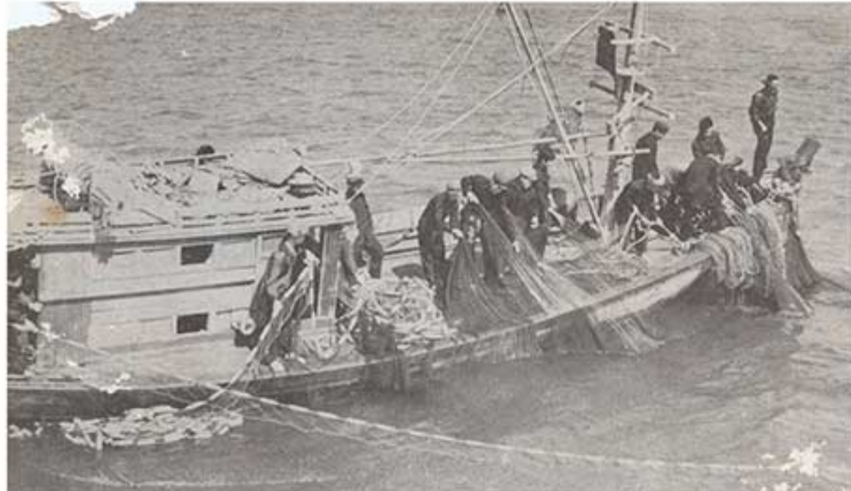
កងនេសាទកំពុងនេសាទនៅលើទូក Fishing Unit worked on a fishing boat