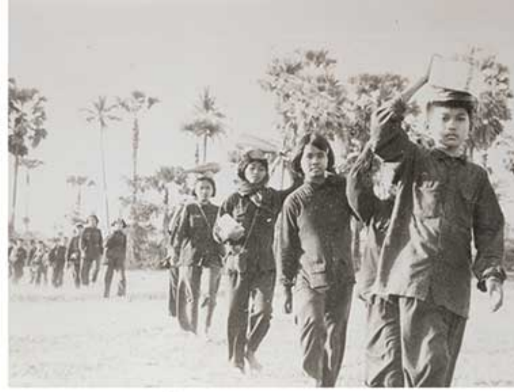
កងដឹកជញ្ជូនកំពុងដឹកជញ្ជូនស្បៀង។ Transportation unit transporting rice.