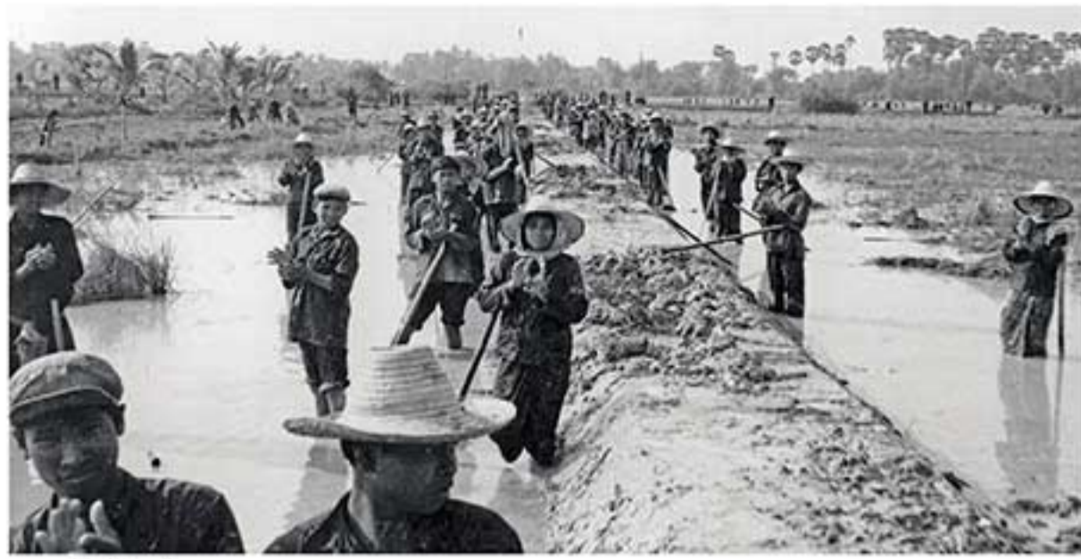
គម្រោងលើកទំនប់ (ថតនៅពេលដែលកម្មាភិបាលជាន់ខ្ពស់ខ្មែរក្រហមធ្វើដំណើរទស្សនាទៅកាន់តំបន់នេះ) An irrigation project (This photo was taken while a Khmer Rouge official delegation was visiting the site)