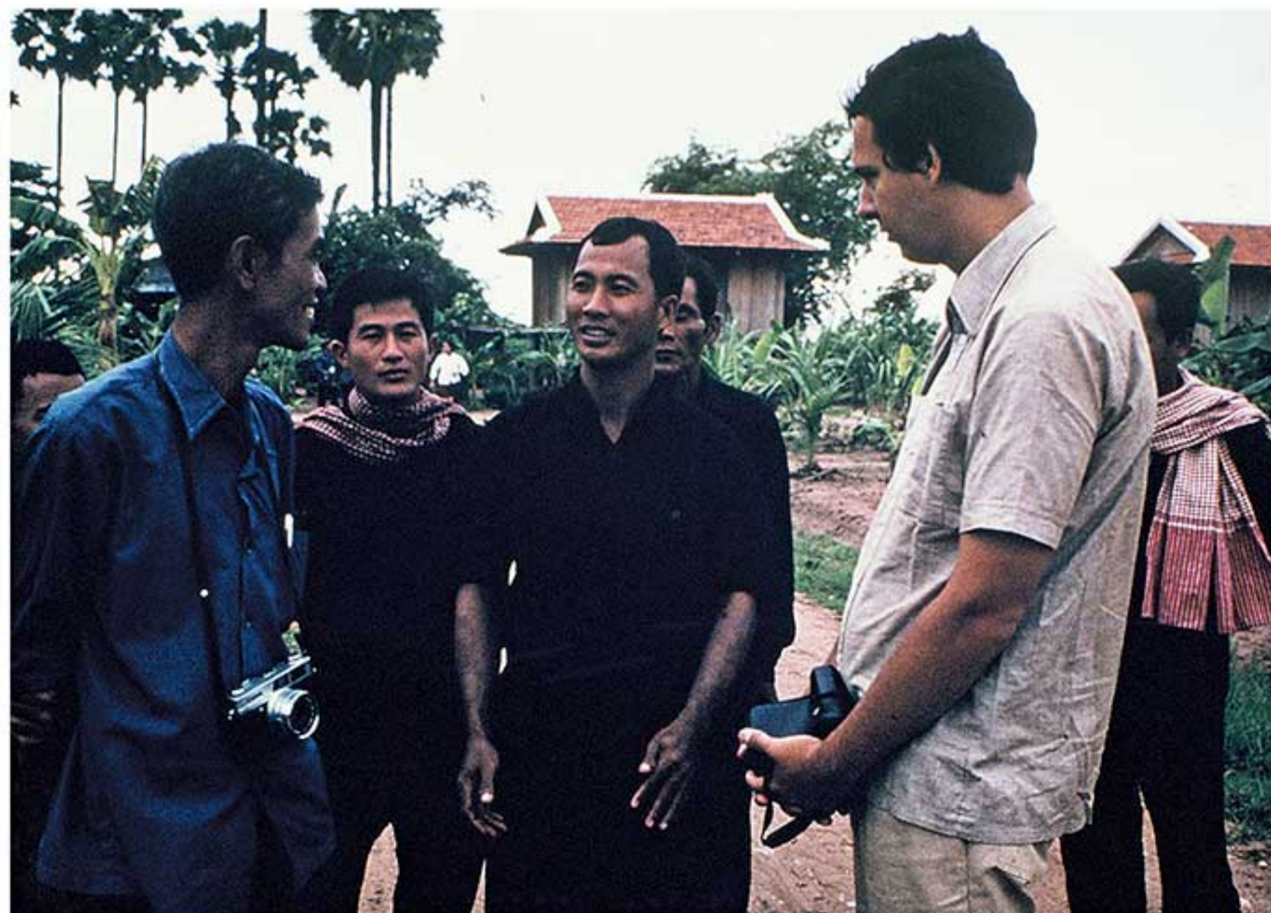
មេដឹកនាំសហករណ៍ Leaders of the cooperative